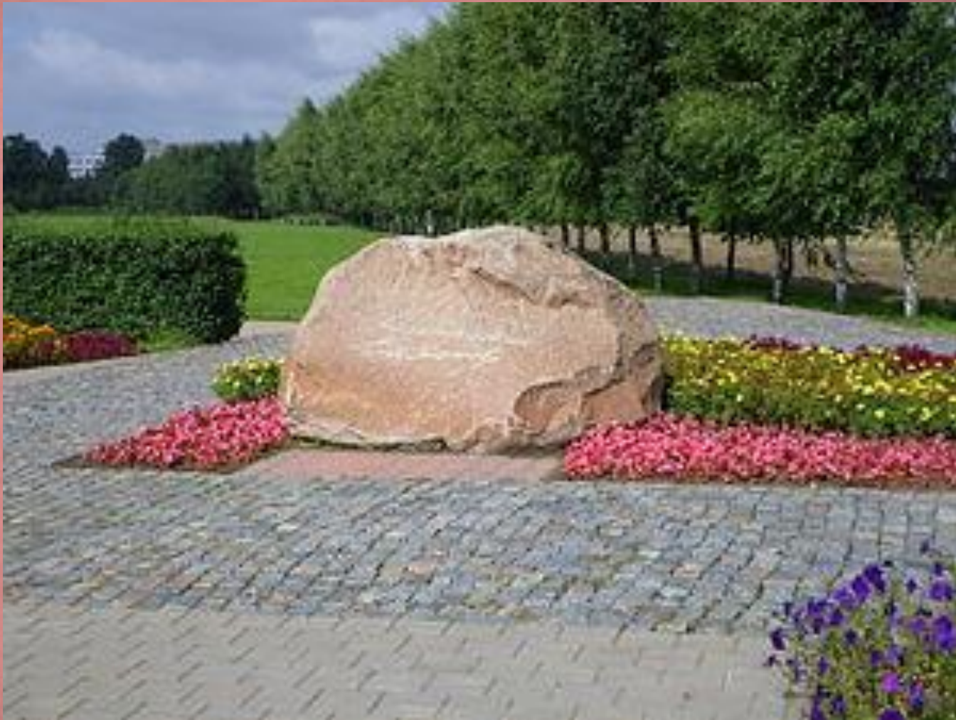
Мемориальный камень, посвящённый памяти К. Симонова, установленный на Буйничском поле.