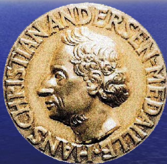
Hans Christian Andersen Medal