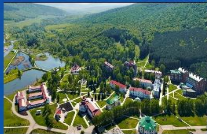
Красноусольские минеральные источники