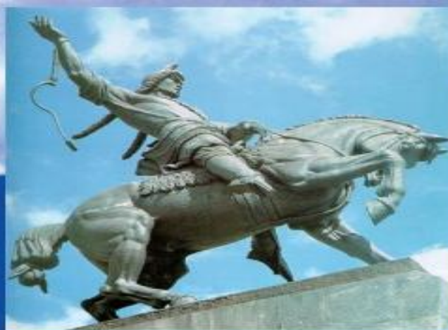
памятник Салавату Юлаеву