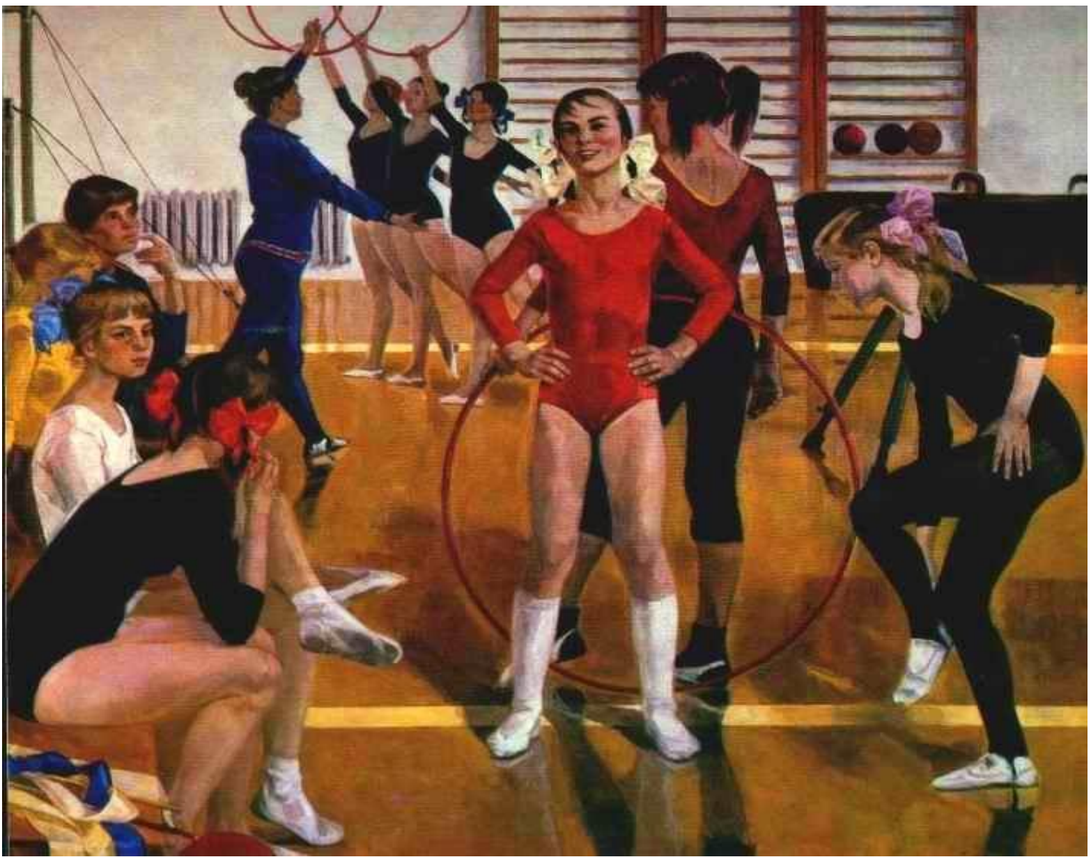
«Детская спортивная школа» (1979)