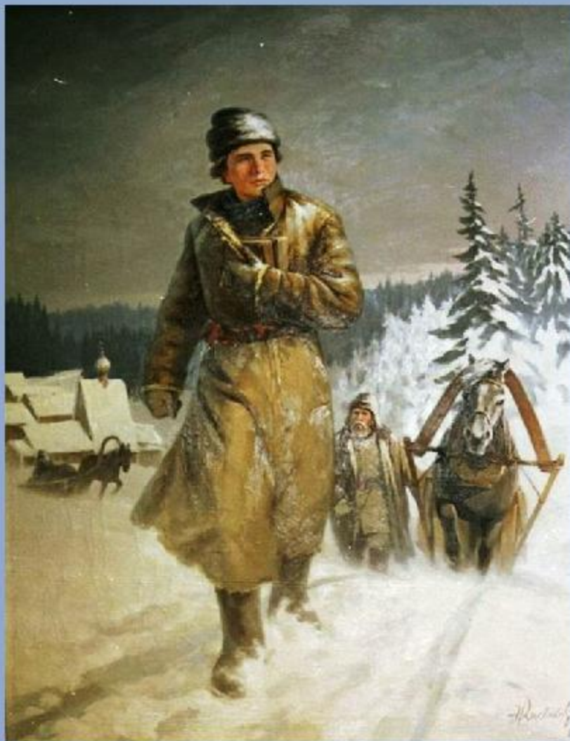
Н.И. Кисляков «Юноша Ломоносов на пути в Москву»