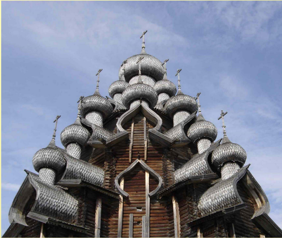
Церковь Преображения Господня (1714 год) — самое знаменитое и выдающееся сооружение ансамбля