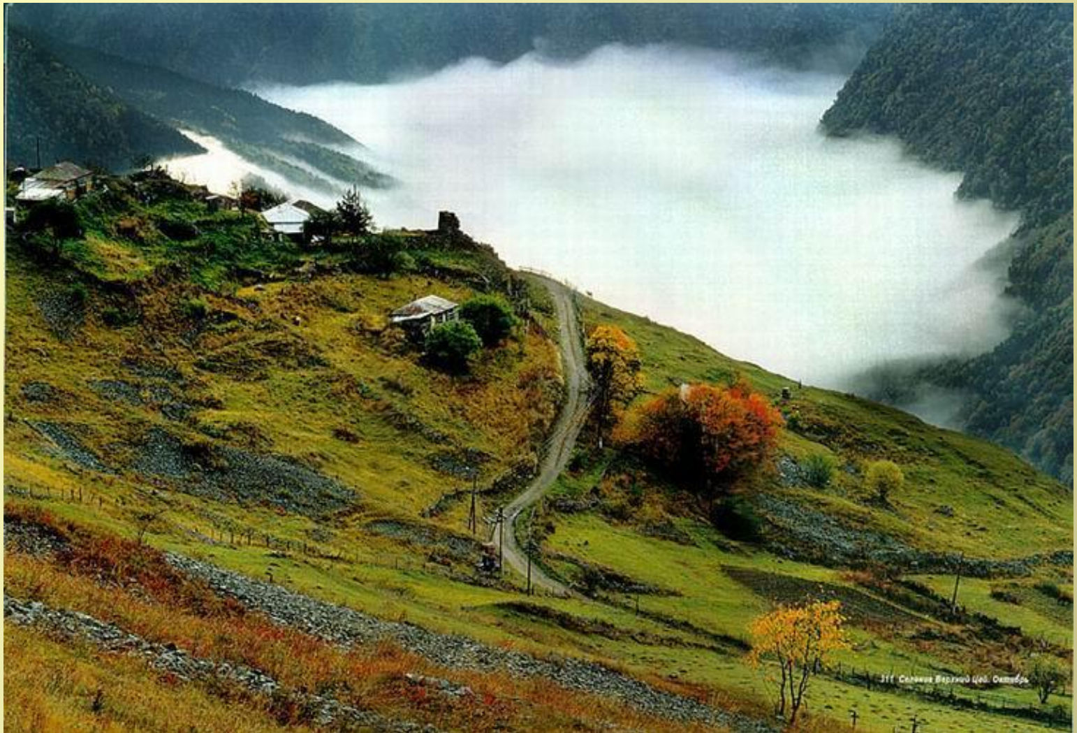
311 Селение Вярнені Цей, Октябрь