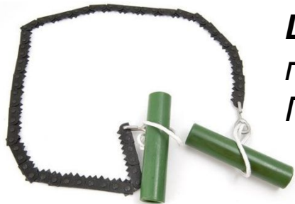
Цепная пила легко помещается в кармане. Пилить может и один