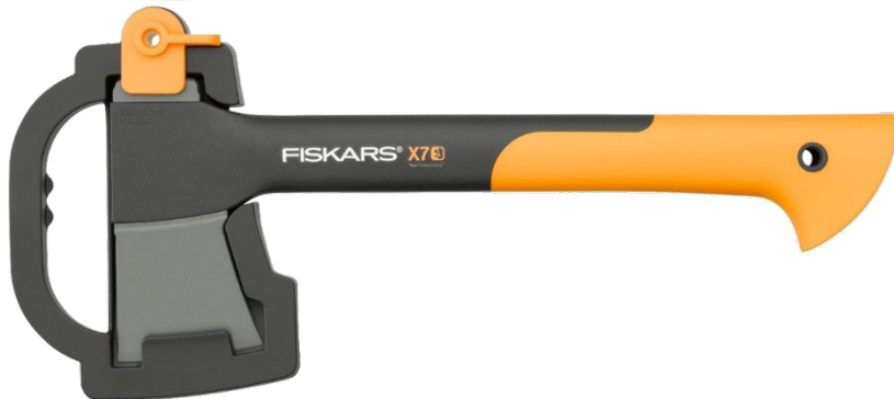
Универсальный топор в удобном и безопасном чехле.