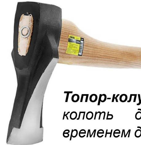
Топор-колун – удобно колоть дрова. Но со временем деревянная ручка начинает вываливаться