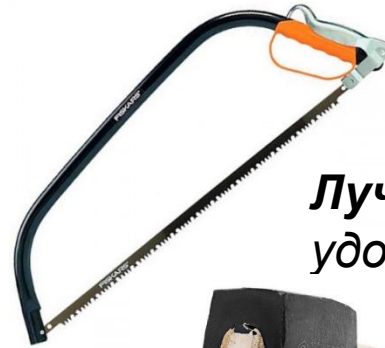
Лучковая пила – легкая и удобная