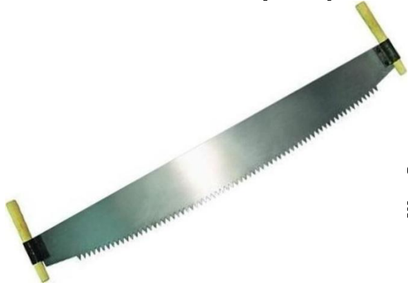
Ручная пила «Дружба» вечная классика