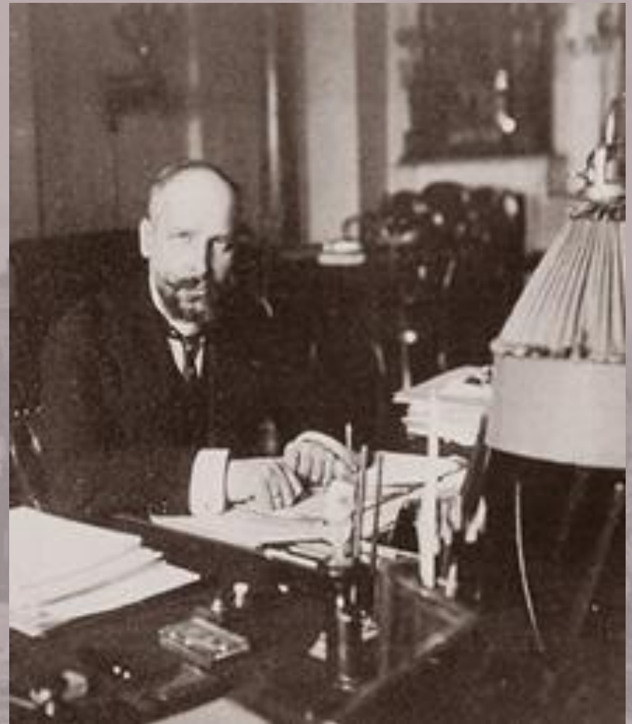
Одна из последних фотографий Столыпина. 1911 г.

Открытие памятника покойному председателю Совета Министров П. А. Столыпину, в г. Киеве, 2 сентября с. г. Памятник высотой 12 аршин. Представляет собой изъ сдвоенного гранита. По сторонам памятника аллегорические фигуры Мещи (русской мещины) и Селяны (русские крестьяне). Памятник возвышается на главной улице Киева, Крещатике, противъ здания городской думы. Все сооружение обошлось въ 120 тыс. руб. На открытии памятника съезжались министры, члены Гос. Совета и Гос. Думы, знавшие политический фракций, многочисленная депутация и высшее духовенство. Черезъ два дня, 7 сентября, состоялось закладка церкви въ с. Столыпинъ Киевск. губ. въ память мученической кончины П. А. Столыпина.