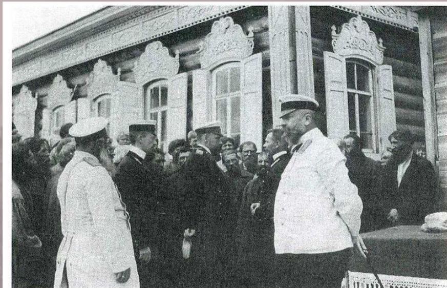
Станция Булгаковка Вольского уезда Саратовской губернии. Июль 1904 года

Как может мужик идти радостно в бой, защищая какую-то арендованную землю в неведомых ему краях? Грустна и тяжела война, не скрашенная жертвенным порывом