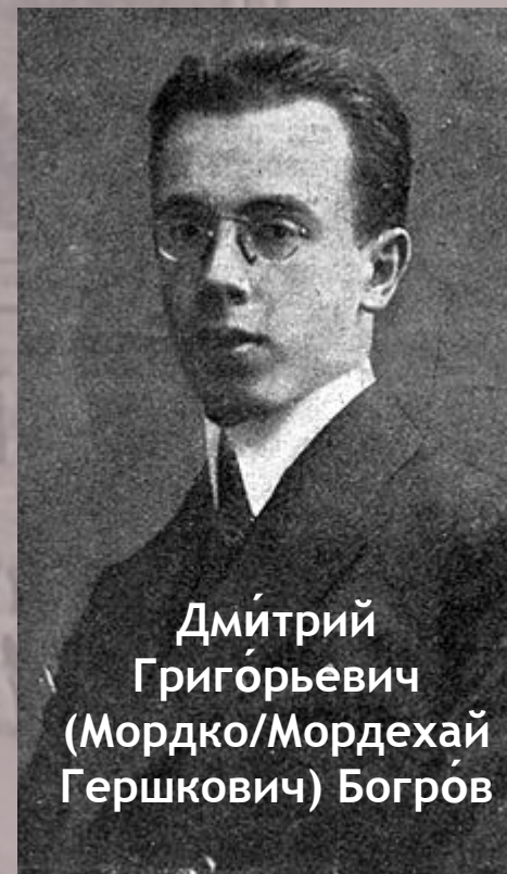
Дмитрий Григорьевич (Мордко/Мордехай Гершкович) Богров

1 сентября 1911 г. все они присутствовали на спектакле в театре Киева. Неожиданно к Столыпину приблизился Дмитрий Богров и выстрелил из браунинга дважды.