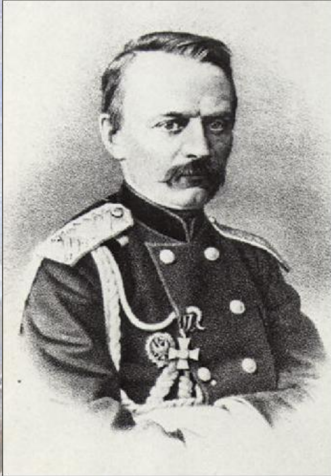
Генерал Столетов Н. Г.