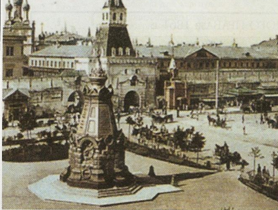
Памятник-часовня гренадерам, павшим под Плевной. Москва, площадь Ильинских ворот, 1901 г.