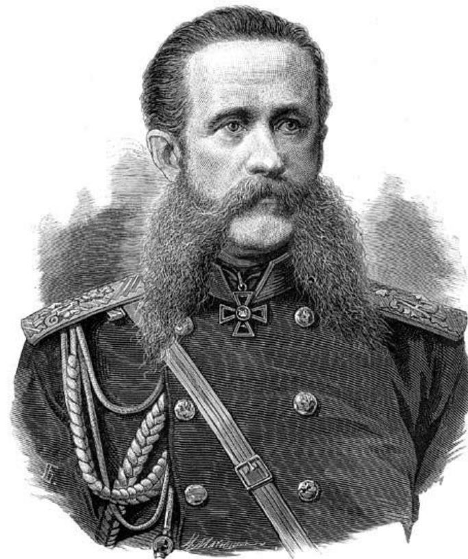
Генерал Гурко Н. В.