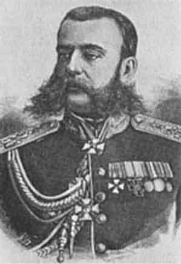
Генерал Скобелев М. Д.