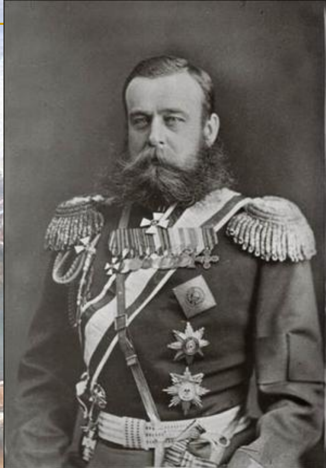
Генерал Криденер Н. П.