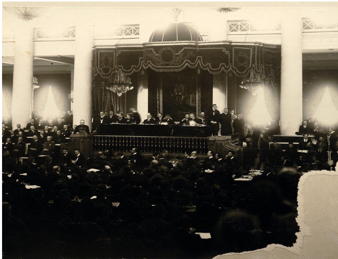
П.А.Столыпин произносит речь декларацию во второй Государственной Думе 6 марта 1907 г.