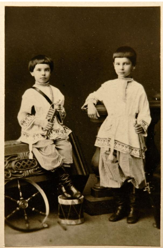
Петр Столыпин семи лет с братом в 1869 г.