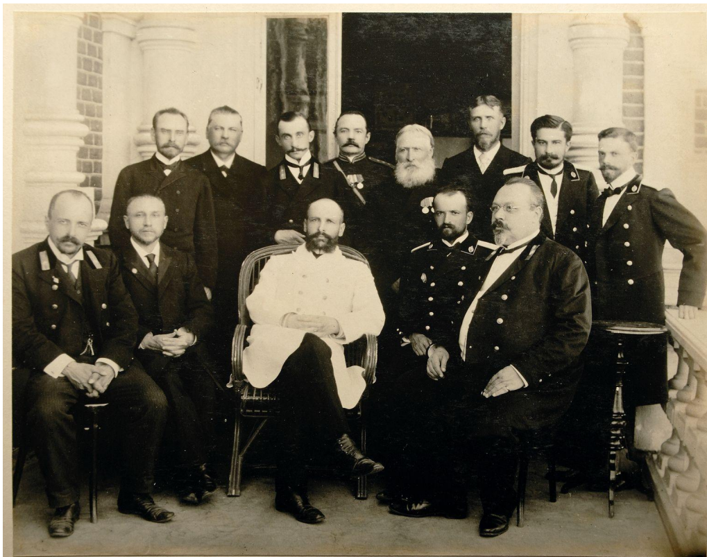
П.А.Столыпин – Саратовский губернатор в поездке в г. Камышинь 1903 г.