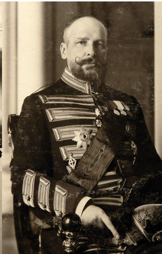
П.А.Столыпин в Зимнем дворце в 1908 г.