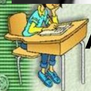
А. Н. Плещеев