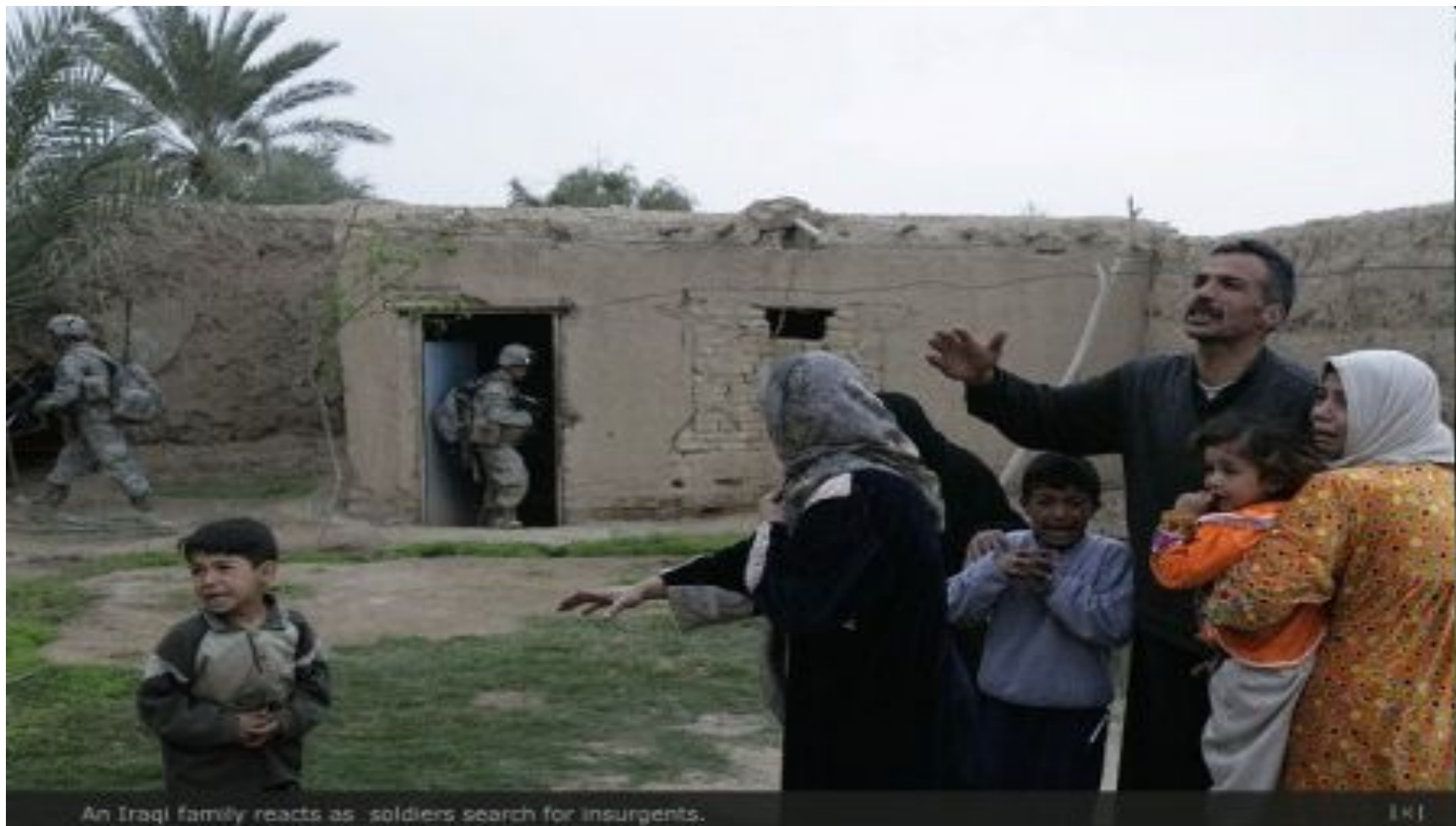
An Iraqi family reacts as soldiers search for insurgents.