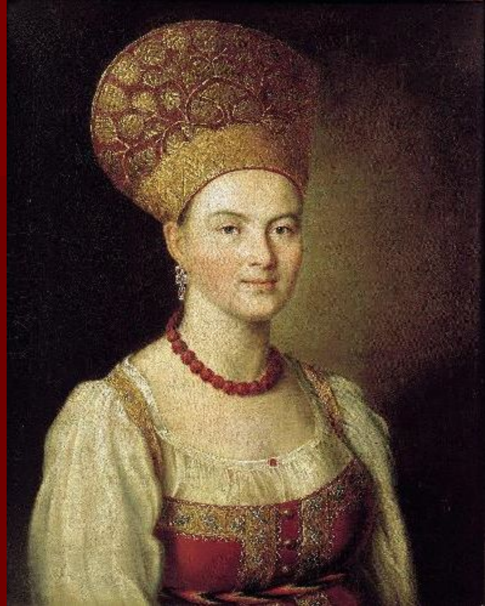
Портрет неизвестной крестьянки в русском costume