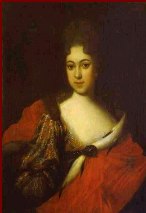
Портрет царевны Прасковьи Иоанновны (1714)

Как старший группы пенсионеров был отправлен в Италию, где не столько учился, сколько оттачивал своё мастерство. В Россию он вернулся с грамотой и лесными отзывами о своём мастерстве. Пётр I в знак внимания дарит Никитину дом.