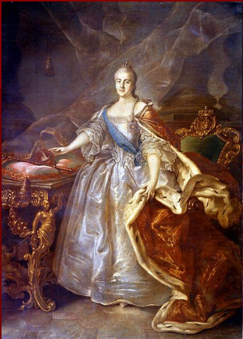
Портрет Екатерины II