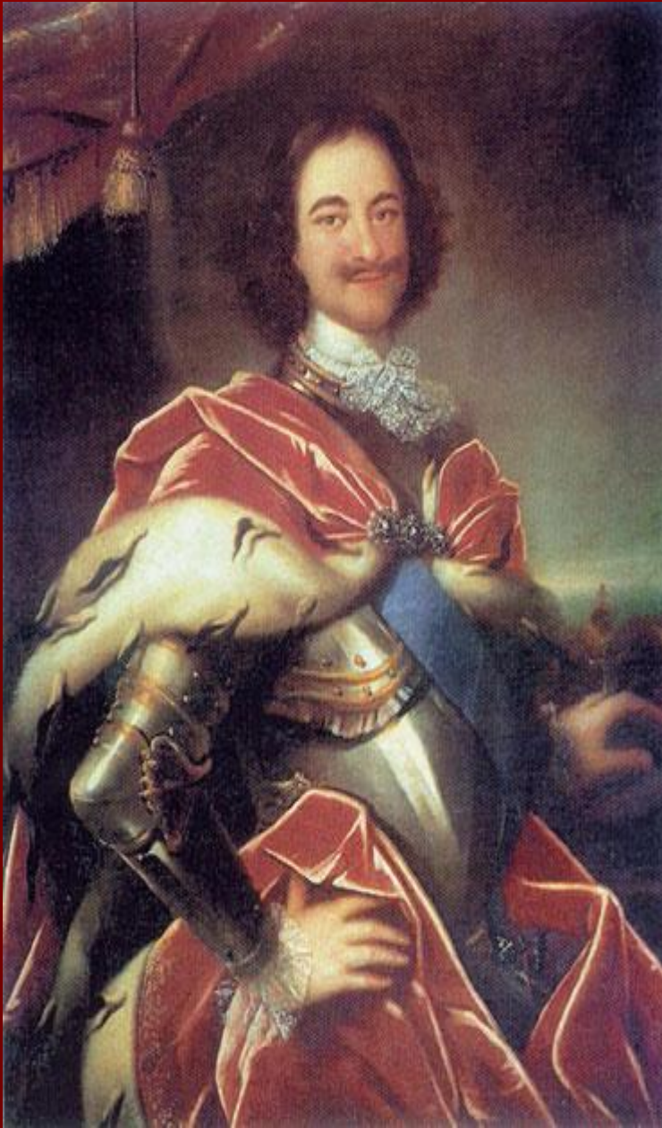
Парадный портрет Петра I