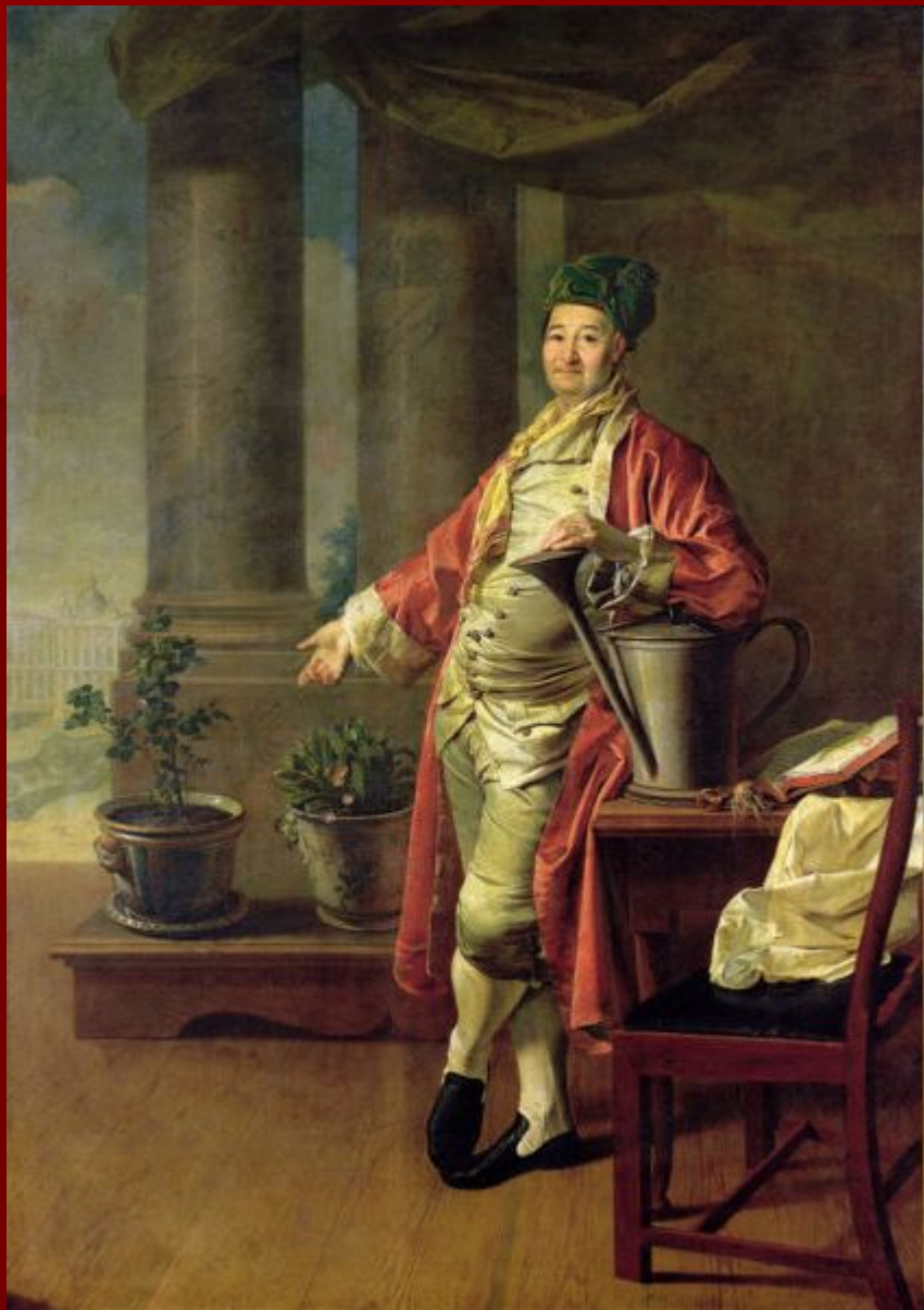
Портрет П. А. Демидова.