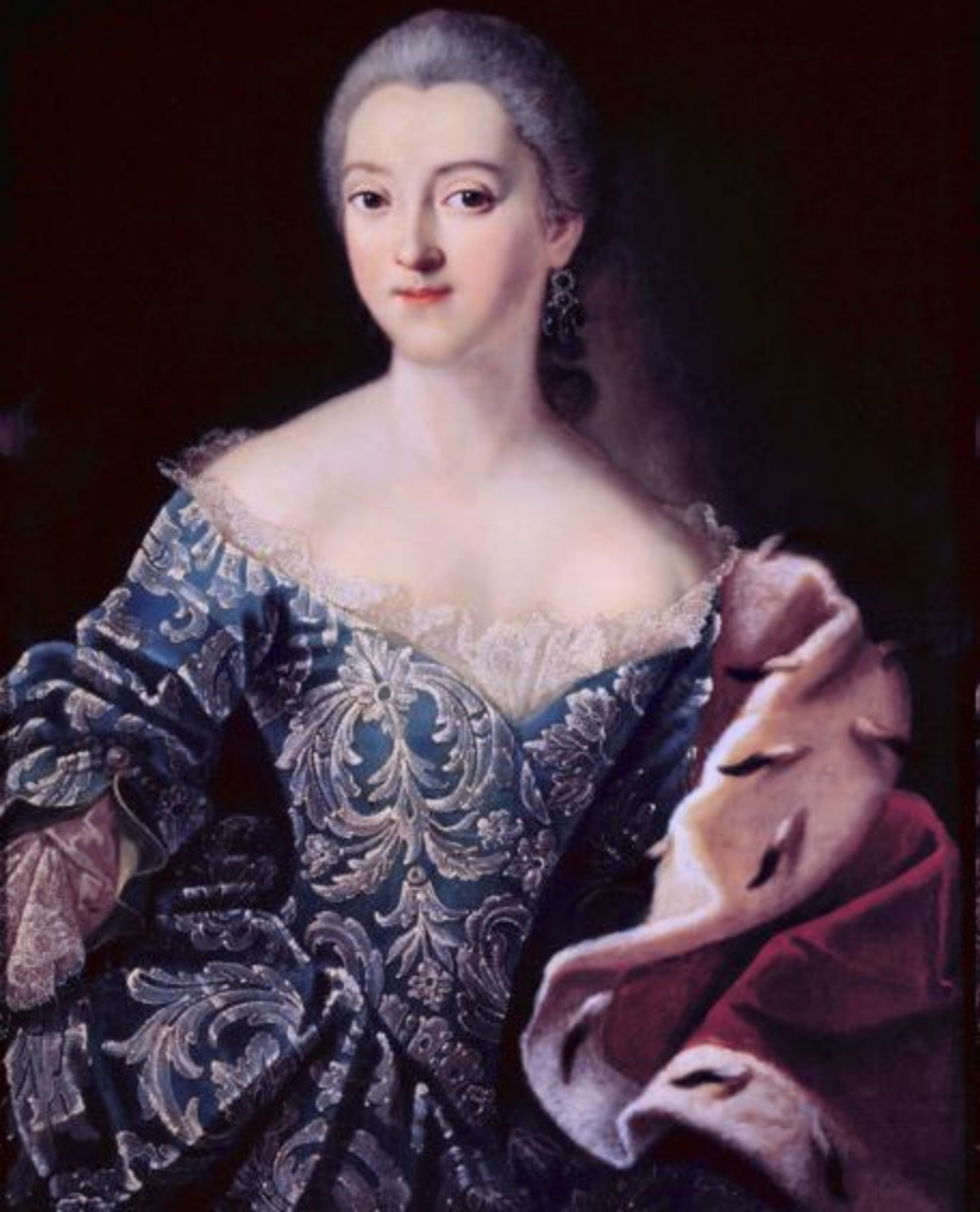
Портрет княгини Екатерины Александровны