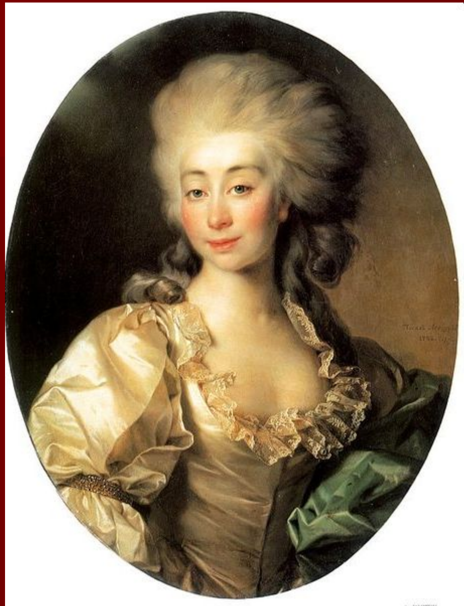
Портрет Урсулы Мнишек.