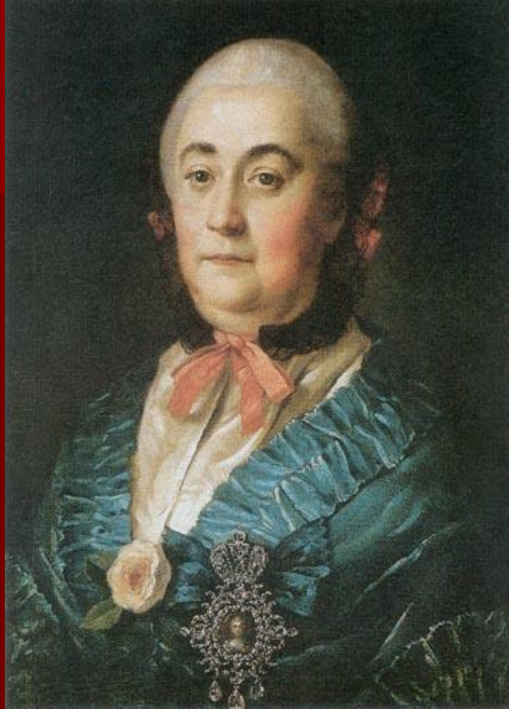
Портрет статс-дамы Измайловой