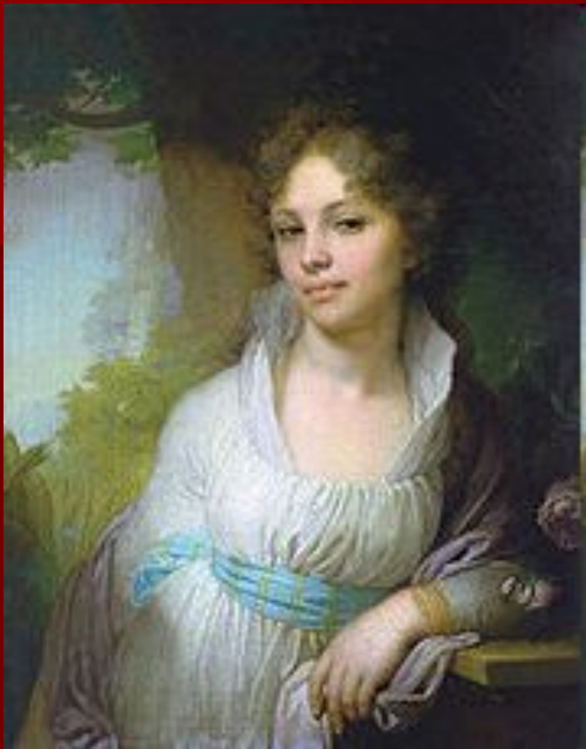
Портрет М. И. Лопухиной