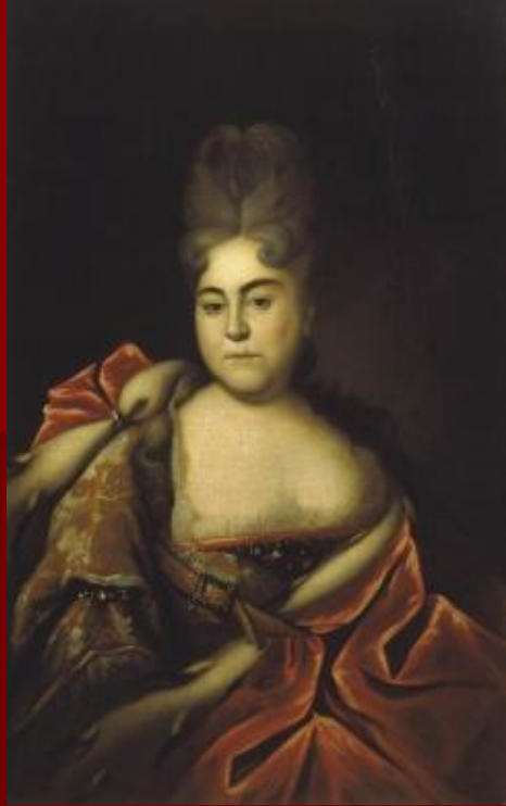
Портрет царевны Натальи Алексеевны