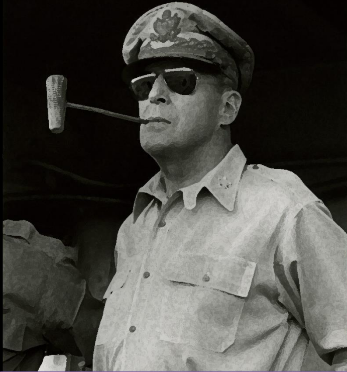
Генерал Дуглас Макартур