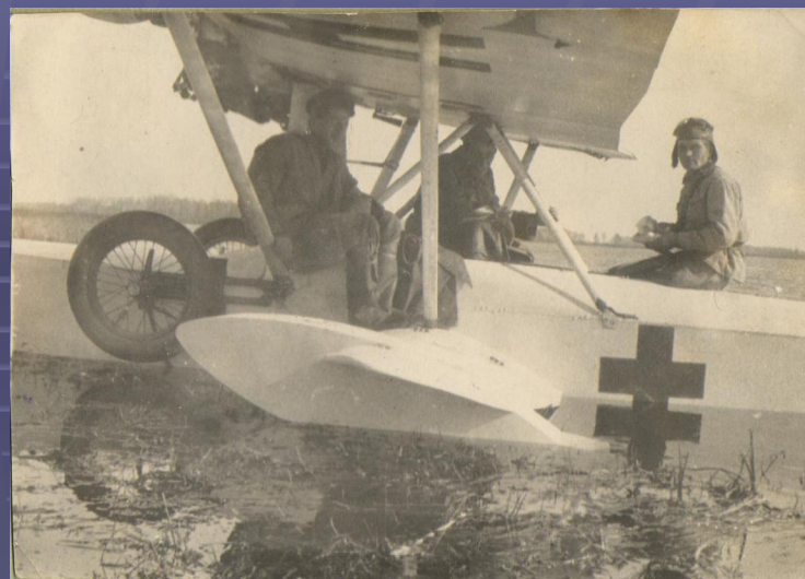
Санитарная авиация самолет Ш-2