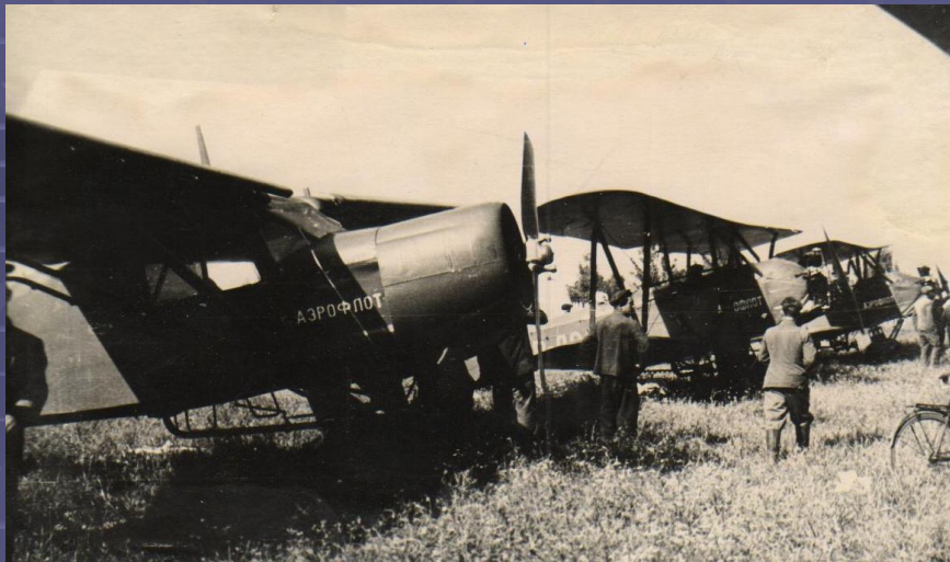
Самолеты По-2 и Як-12 на аэродроме