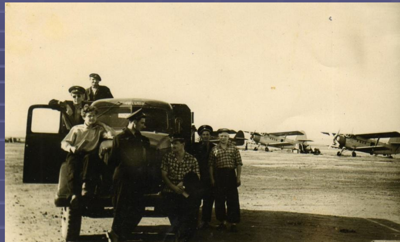
Выезд на полеты