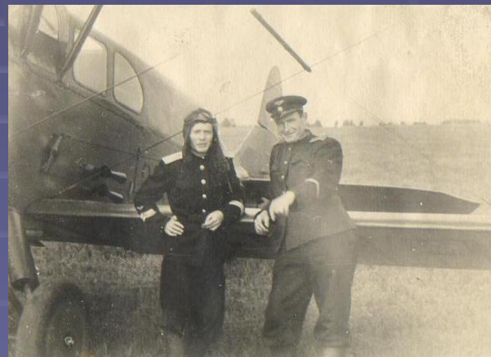
у «лимузина» По-2Л