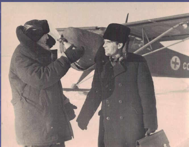
перед вылетом на санзадание