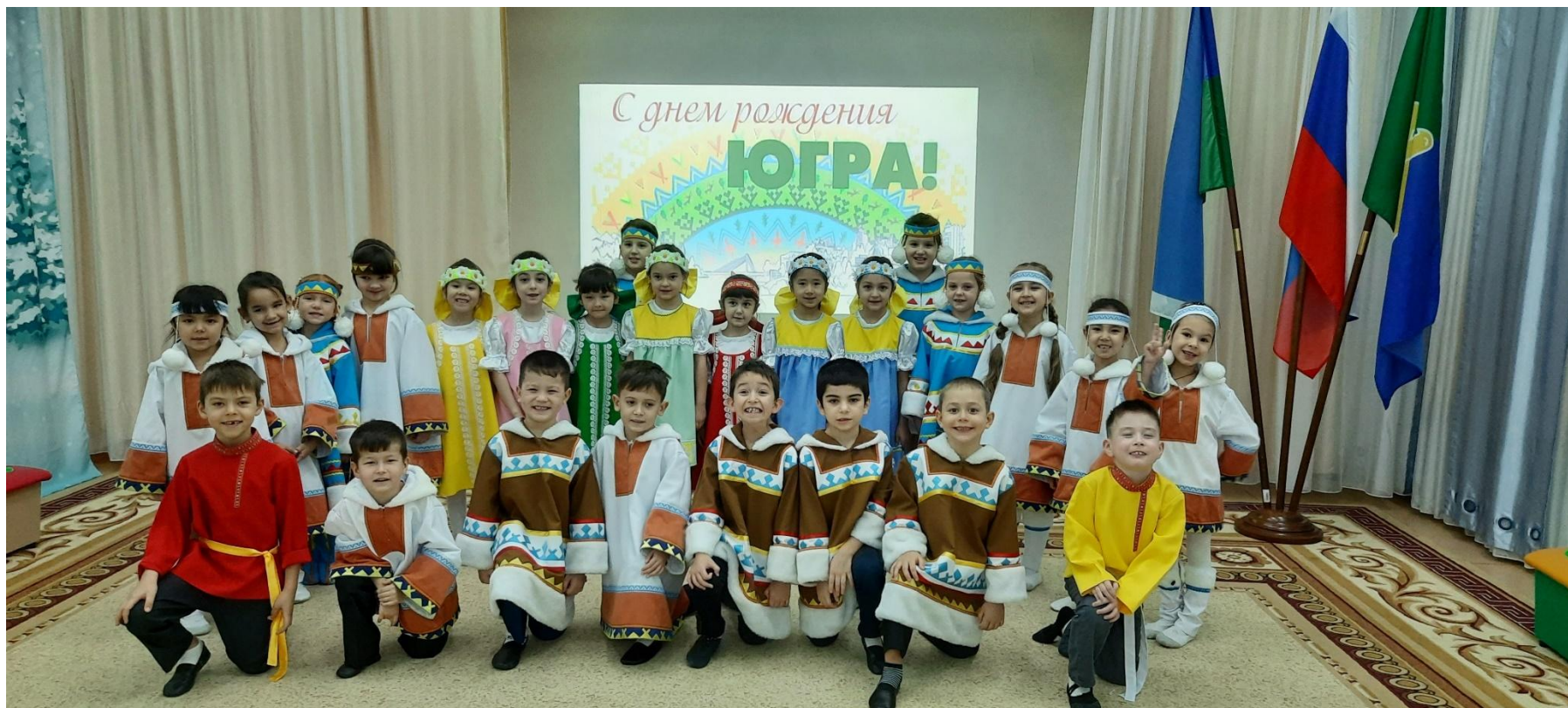
День рождения Югры