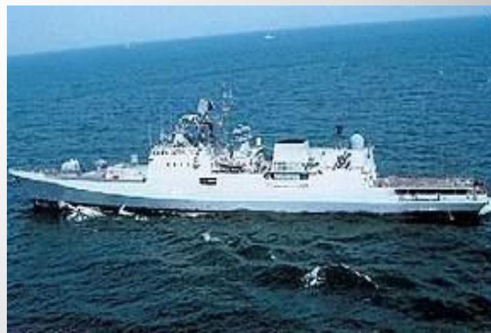
Индийский военный корабль "Табар"