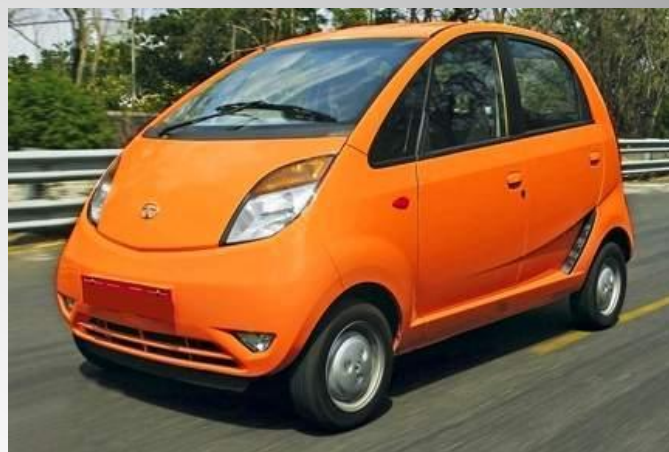
Индийский автомобиль «Tata Nano»

Также развит авиационный, автомобильный, морской и речной транспорт.