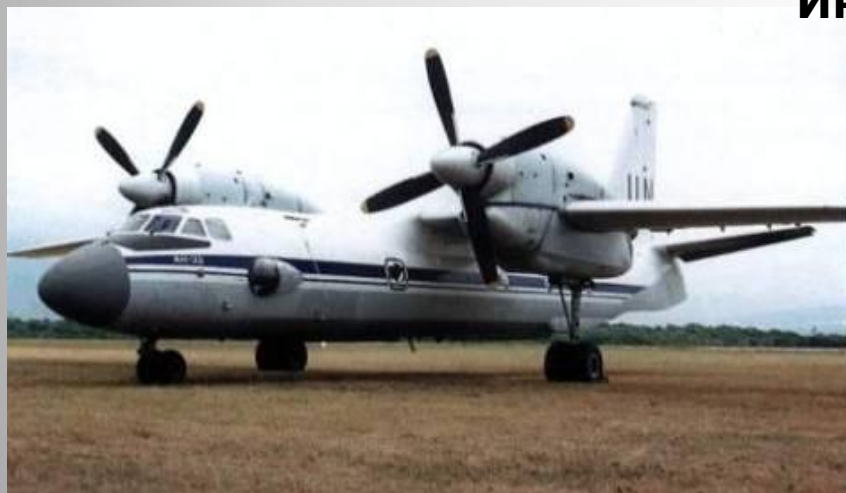
Ан-32. ВВС Индии