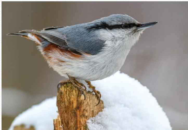
Поползень, Sitta europaea (Отряд Воробьинообразные, Семейство Поползневые)