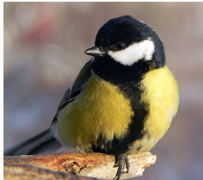
Синица большая, Parus major (Отряд Воробьинообразные, Подотряд Певчие, Семейство Синицевые)