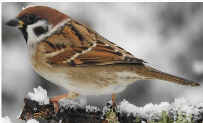
Воробей полевой, Passer montanus (Отряд Воробьинообразные, Семейство Воробьиные, Род Настоящие воробьи)