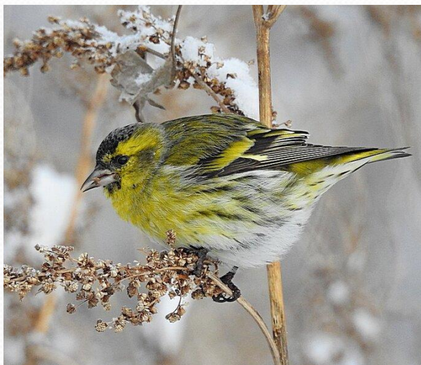
Чиж, Carduelis spinus

(Отряд Воробьинообразные, Подотряд Певчие, Семейство Вьюрковые, род Щеглы)