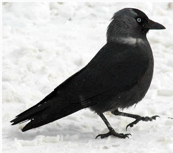
Галка, Corvus monedula (Отряд Воробьинообразные, Семейство Врановые, Род Ворон)

Дрозд рябинник, Turdus pilaris (Отряд Воробьинообразные — Passeriformes, Семейство Дроздовые — Turdidae, Род Дрозды — Turdus )