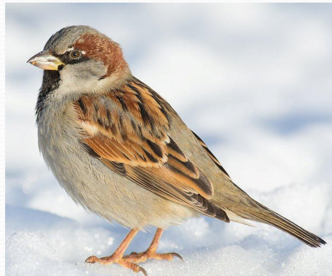
Воробей домовый, Passer domesticus (Отряд Воробьинообразные, Семейство Воробьиные, Род Настоящие воробьи)