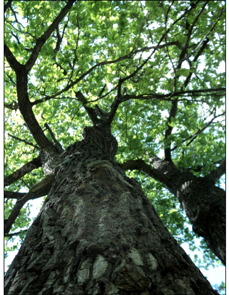
Quercus robur L. - Дуб черешчатый