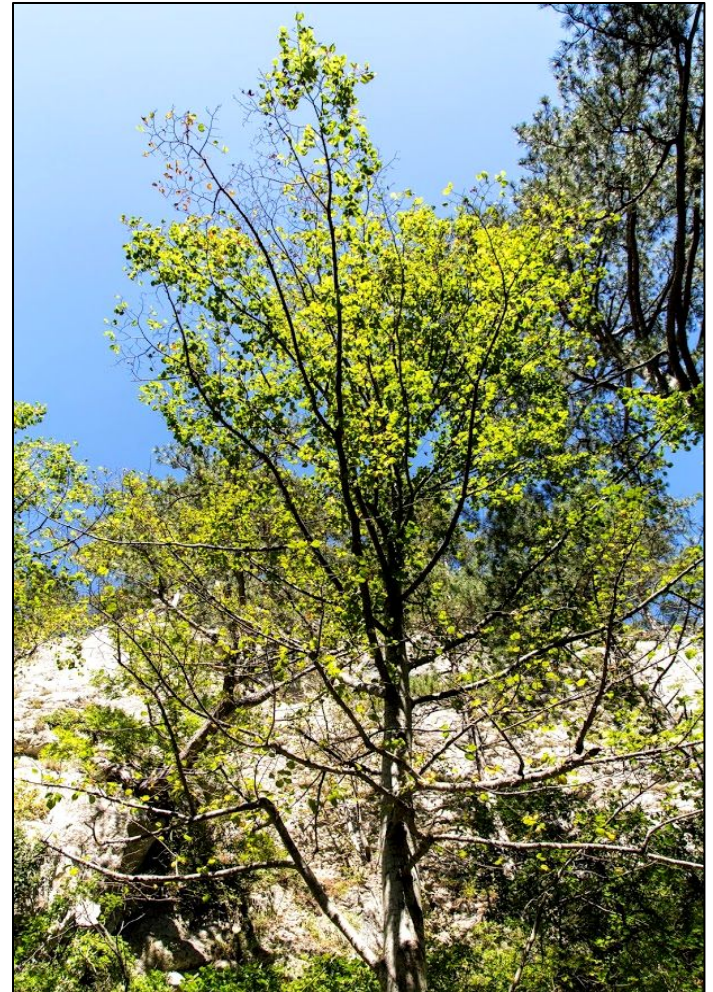
Corylus avellana L. - Лещина обыкновенная