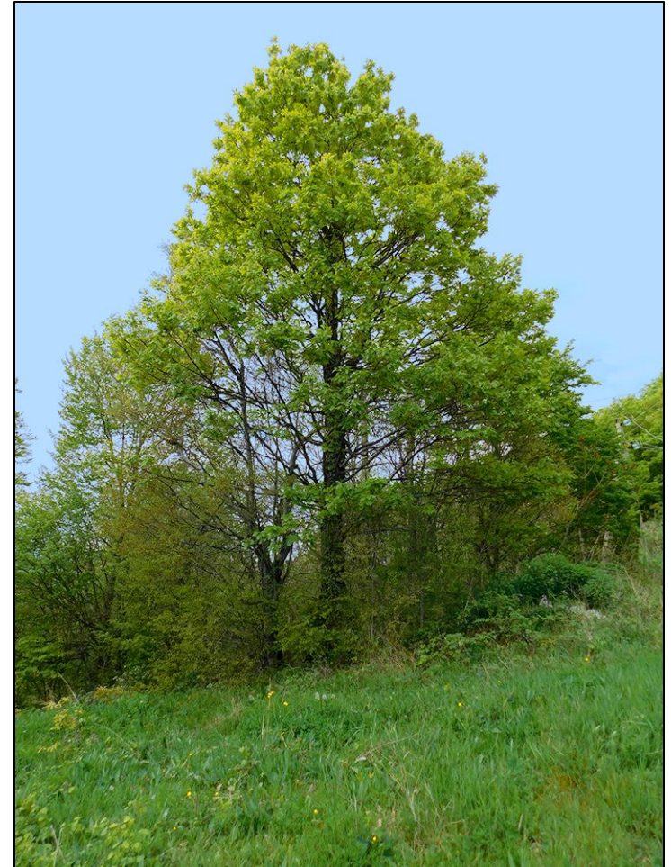
Quercus petraea (Matt.) Liebl. - дуб скальный