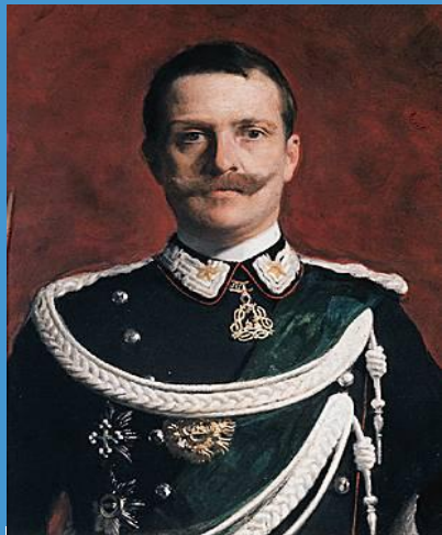
Виктор Эммануил III 29 июля 1900 9 мая 1946

В 1900 г. король был застрелен анархистом, считавшим Умберто I виновным в нищете итальянского народа.