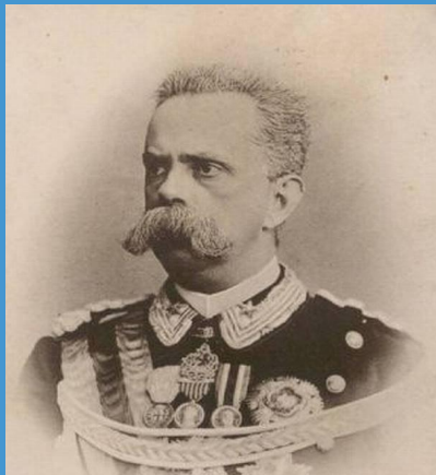
Умберто I 9 января 1878 29 июля 1900

Он был малопригоден для управления страной, но стремился к территориальным захватам.