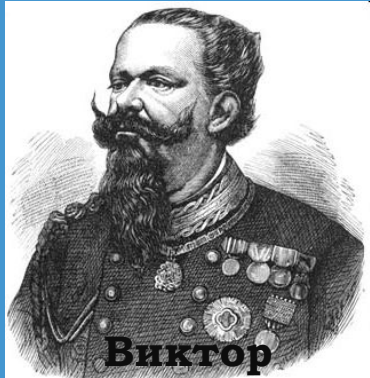
Виктор Эммануил II 28 июля 1849 17 марта 1861