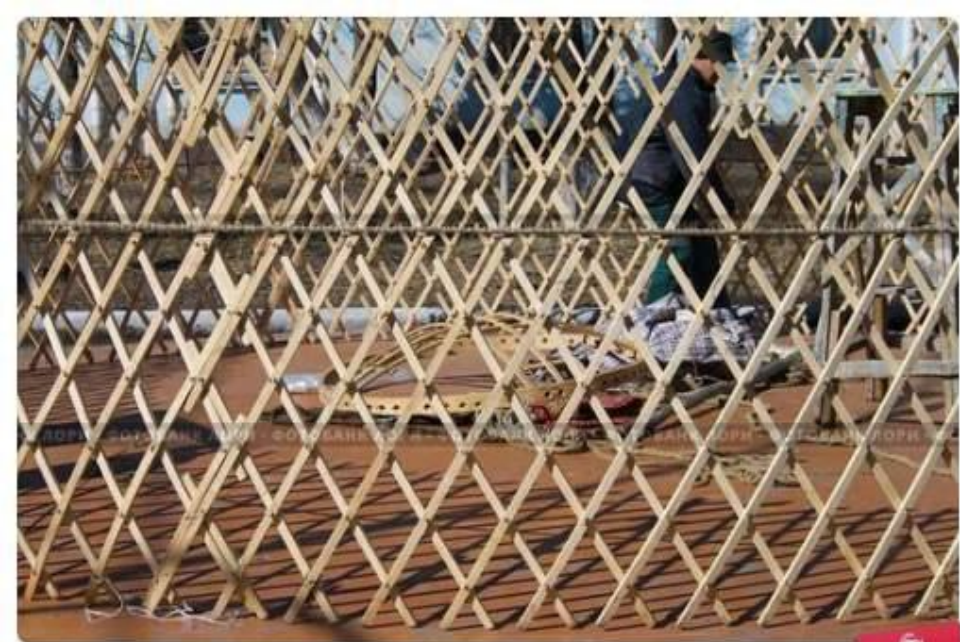
Фрагмент каркаса юрты. Кереге