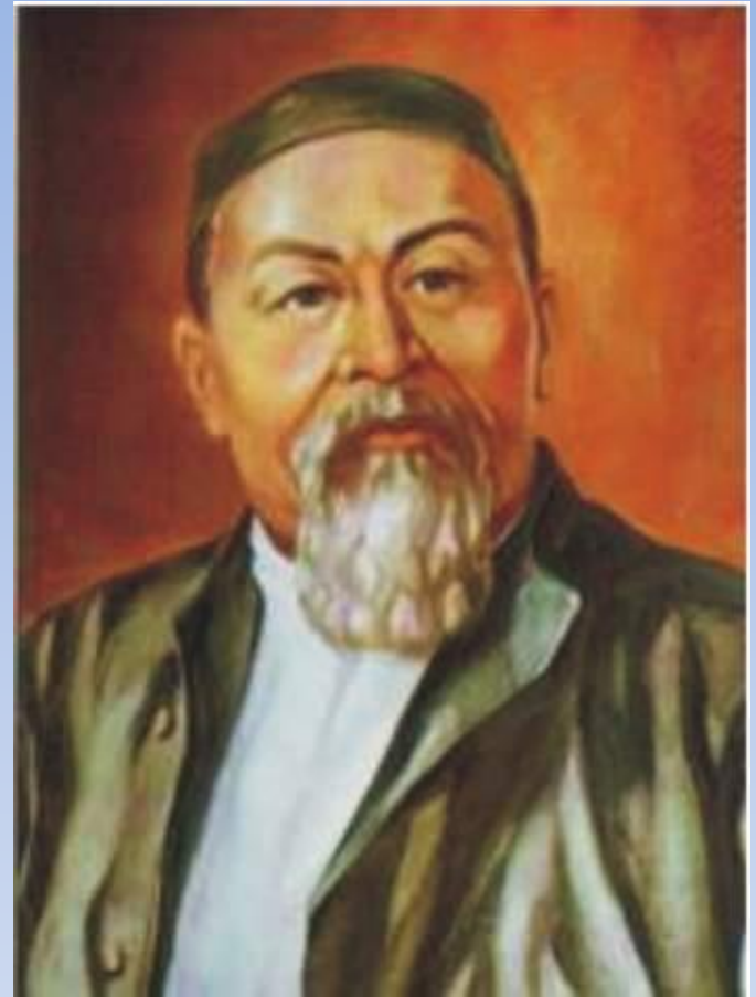
Абай Құнанбаев 1845 – 1904