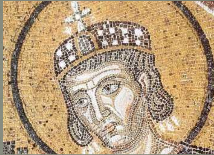
Император Константин. Фрагмент мозаики.

Догмат – наиболее важные положения вероучения, обязательные для всех верующих.