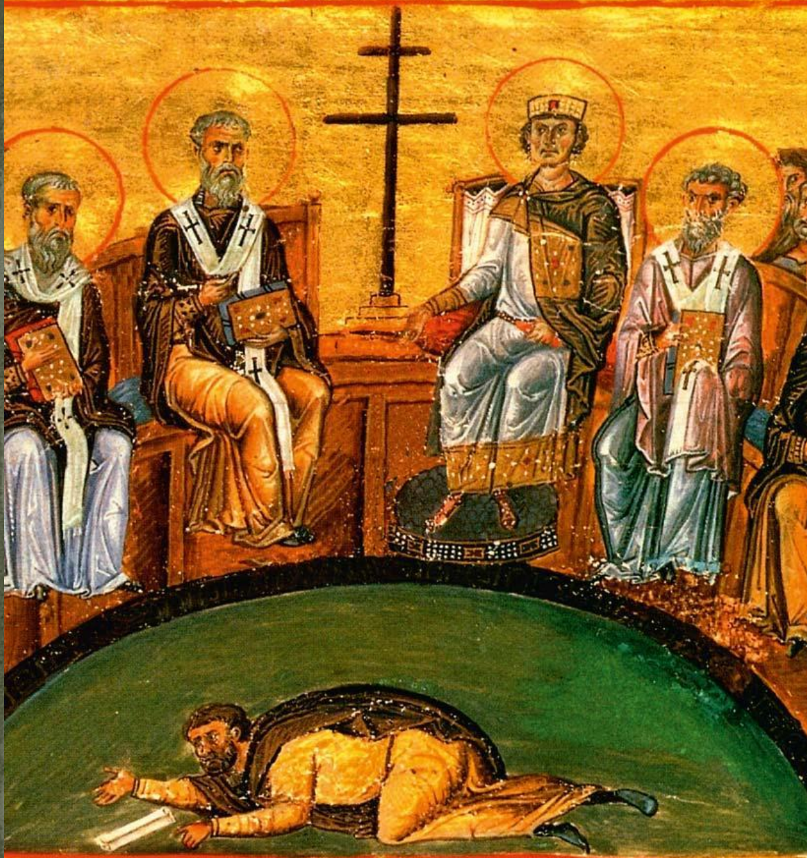
Никейский собор осуждает учение Ария — изображение IV века