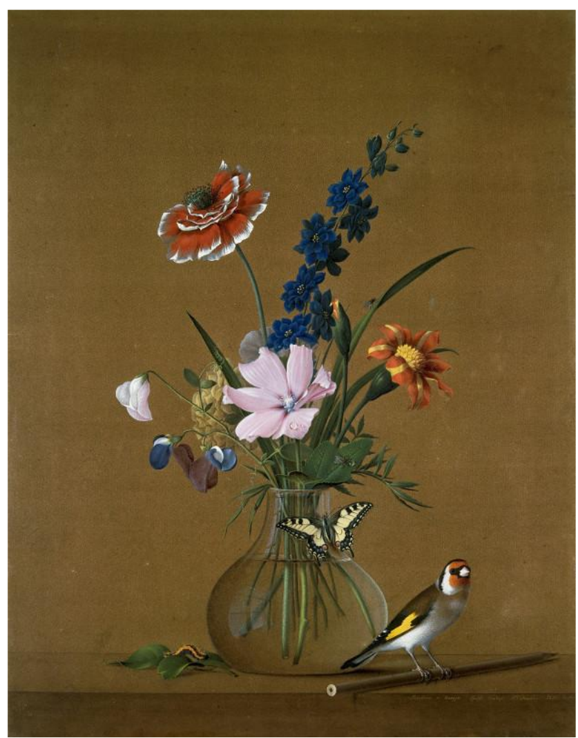
"Букет цветов, бабочка и птичка"