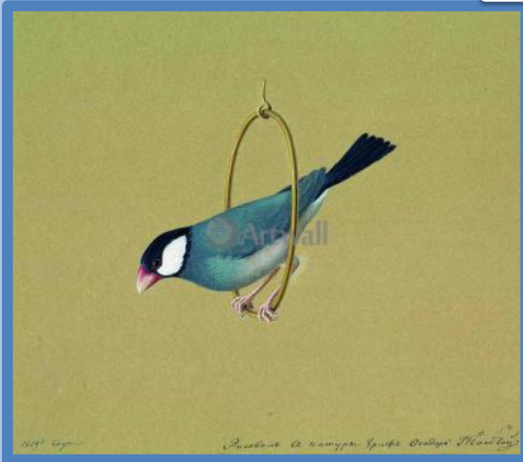
«Птичка в кольце»