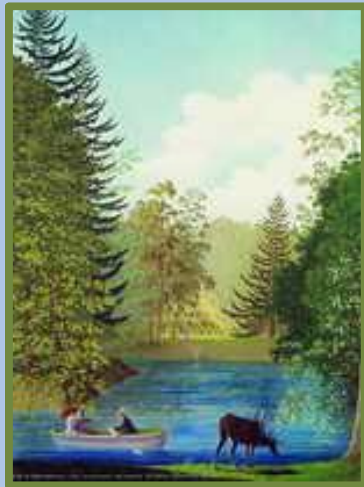
«Вид в Парголовском»