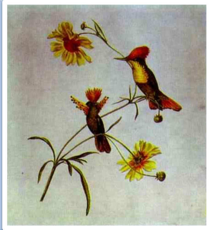
«Птицы и цветы»