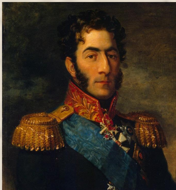
П. И. Багратион