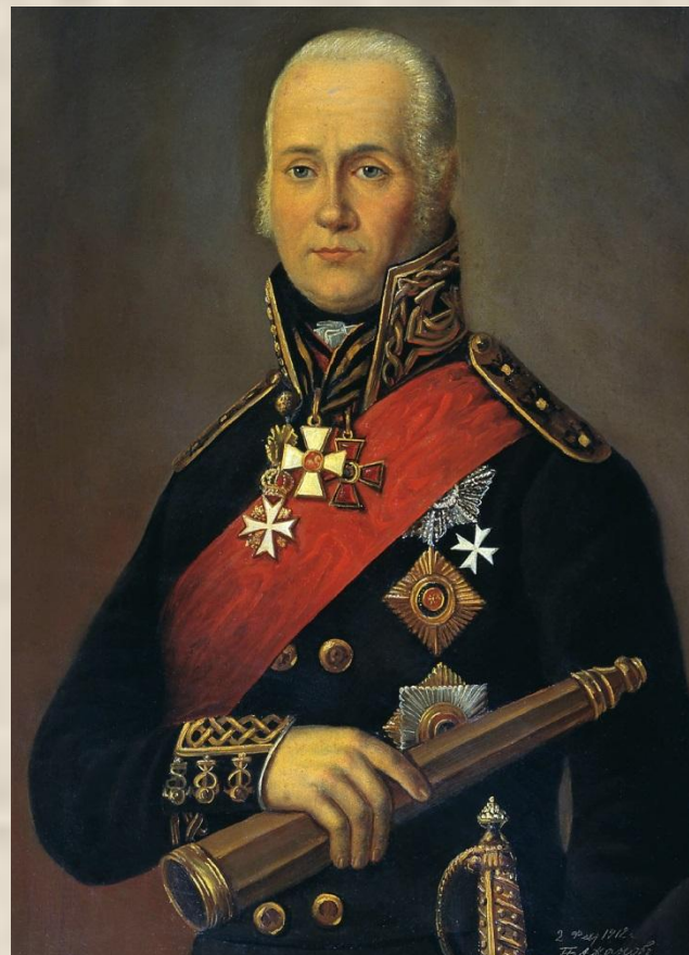
Адмирал Ф. Ф. Ушаков