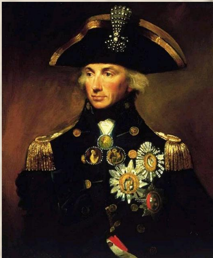
Адмирал Горацио Нельсон