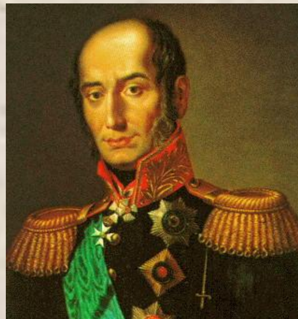
М. Б. Барклай де Толли