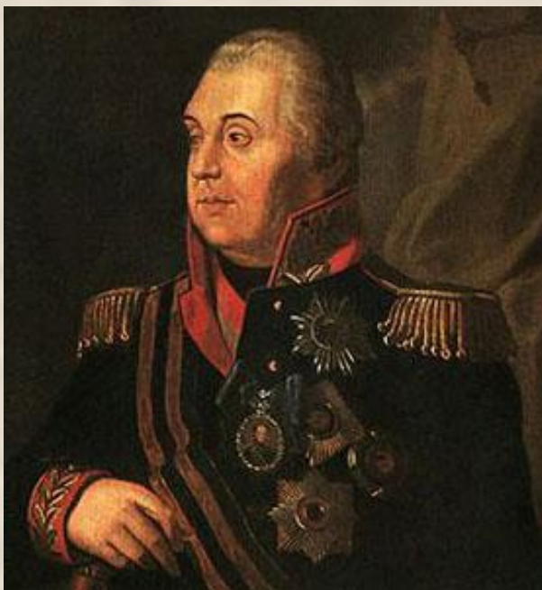
М. И. Кутузов