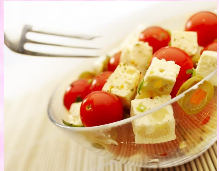
Легкий салатик с помидорами и сыром