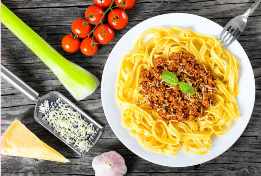
Спагетти с сыром и зеленью