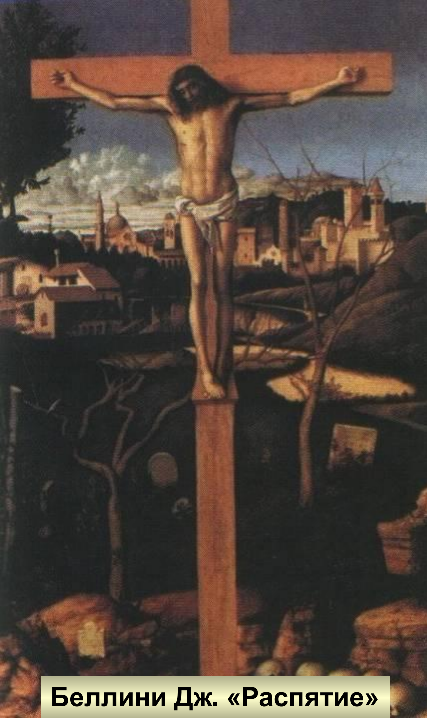
Беллини Дж. «Распятие»