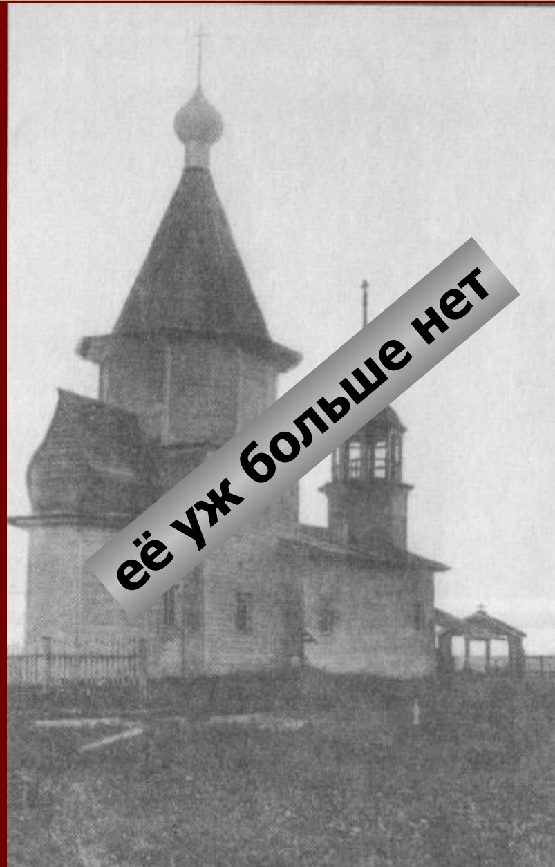
Церковь во имя Спасителя и Чудотворца Николая в Шотогорке