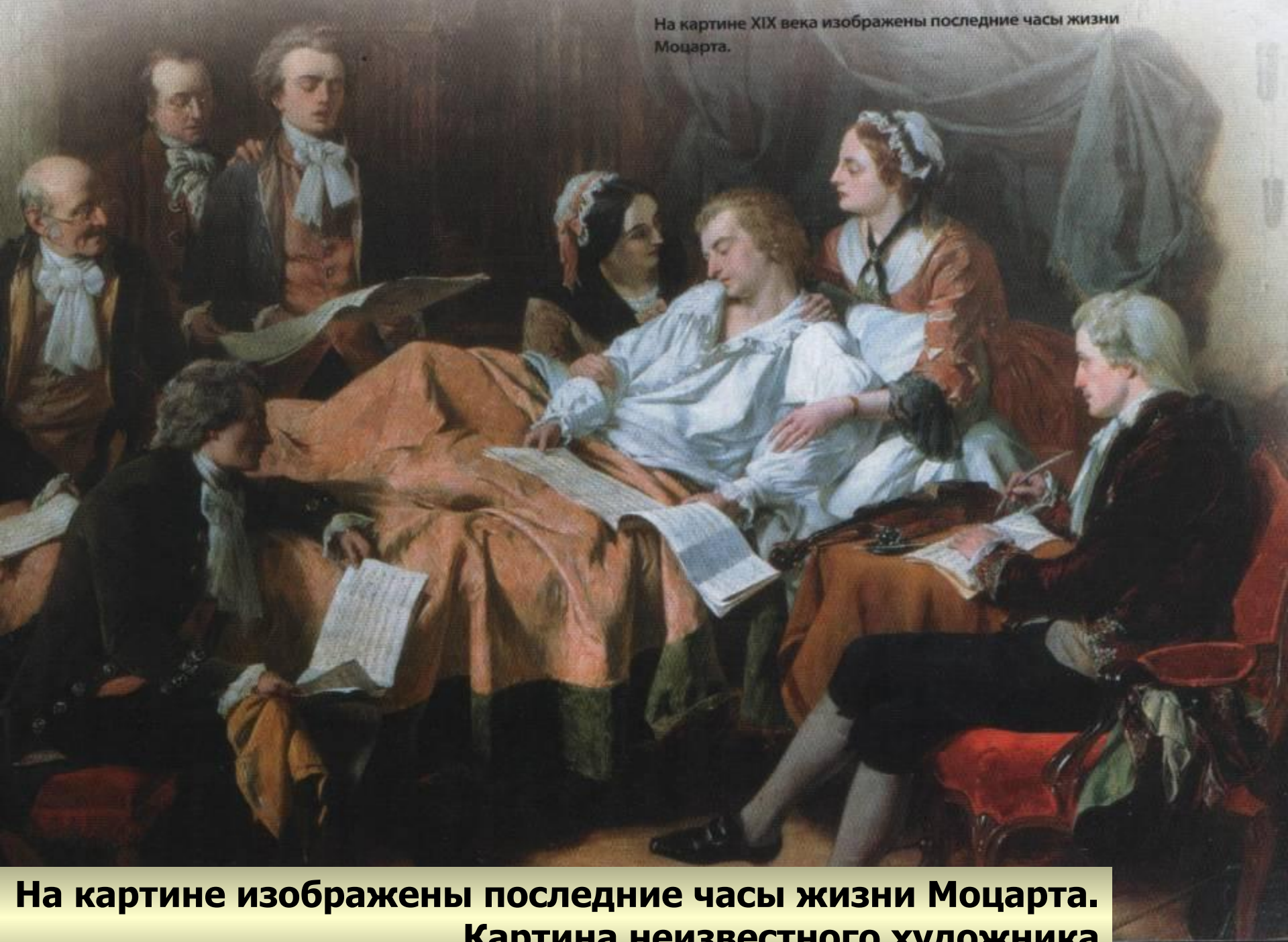
На картине изображены последние часы жизни Моцарта. Картина неизвестного художника

На картине XIX века изображены последние часы жизни Моцарта.