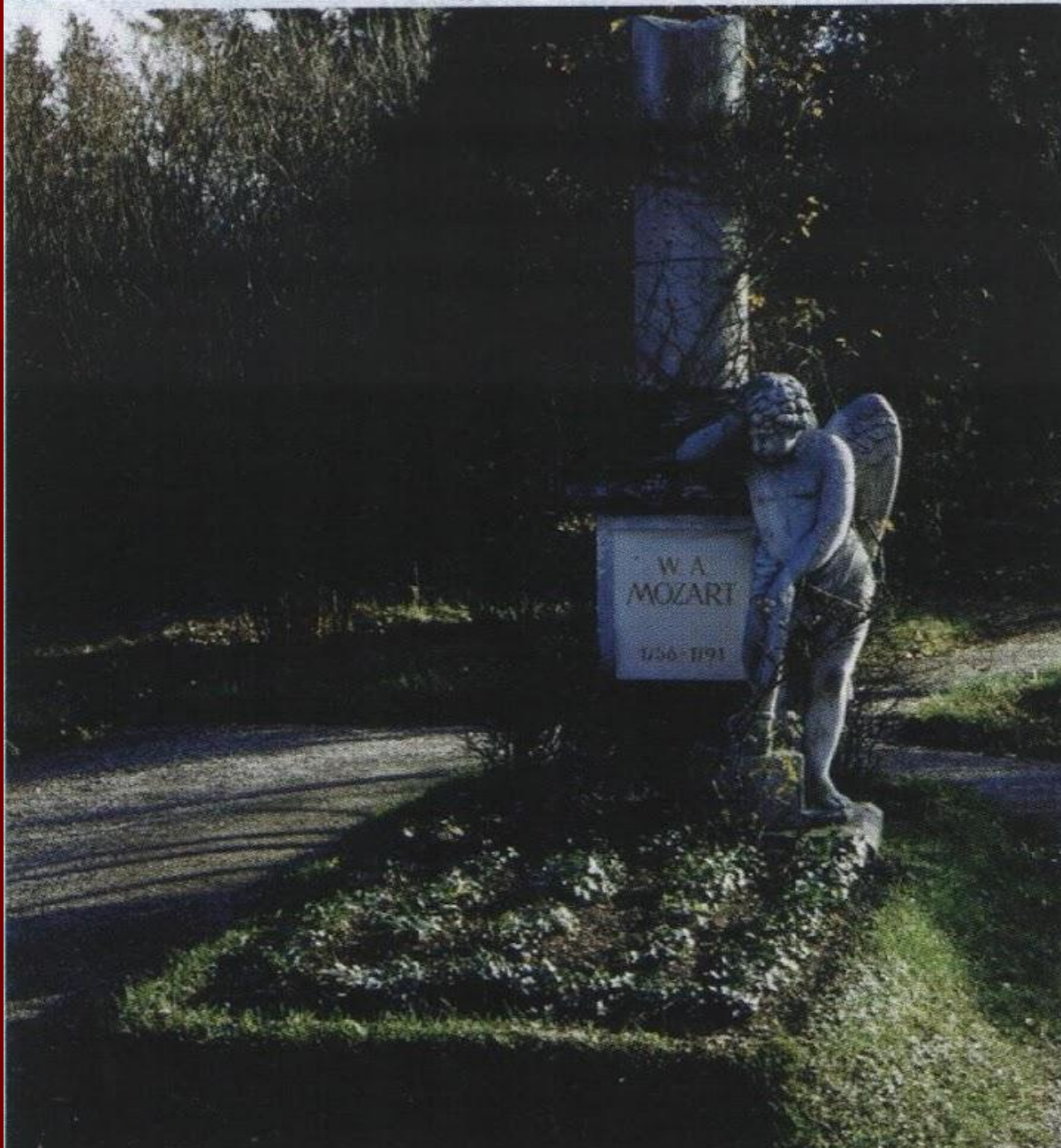
В углу кладбища святого Марка установлен памятник Моцарту – статуя плачущего ангела