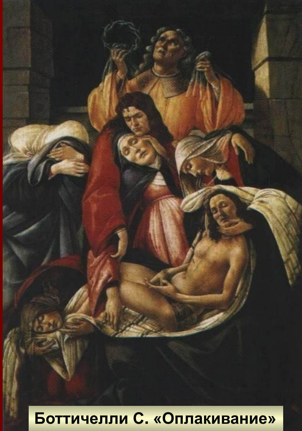
Боттичелли С. «Оплакивание»