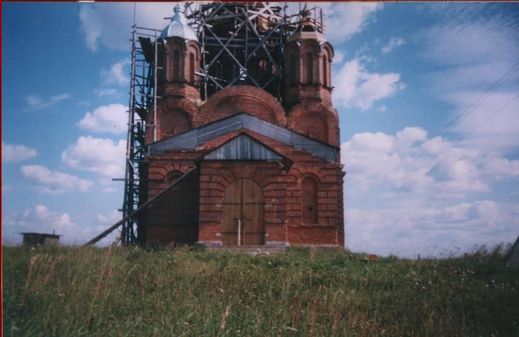
Никольский храм в деревне Шотовой