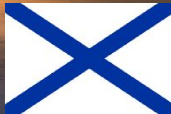
Военно-морской флаг России