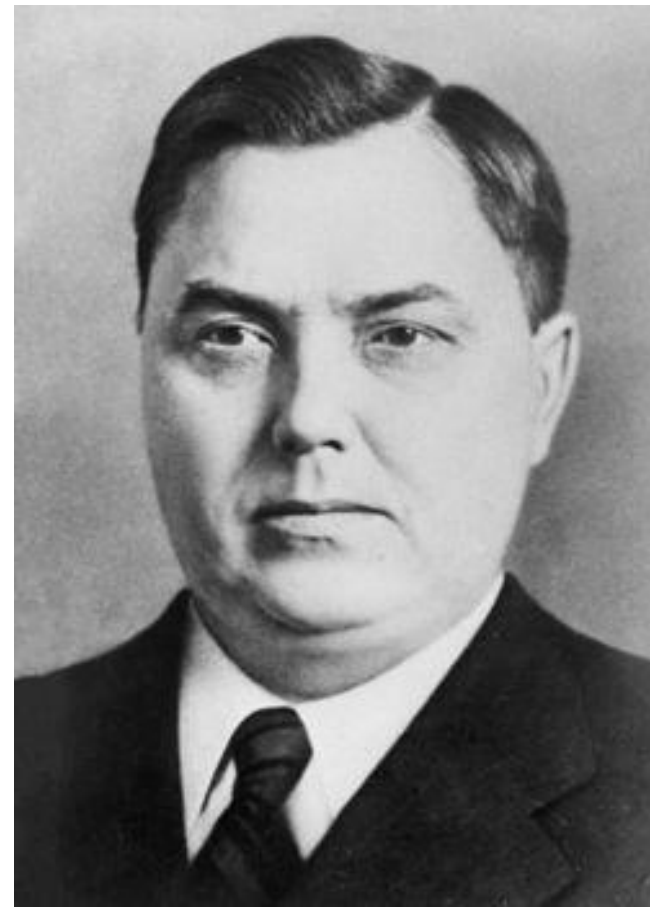
Маленков Георгий Максимилианович, 8.01.1902 – 14.01.1988