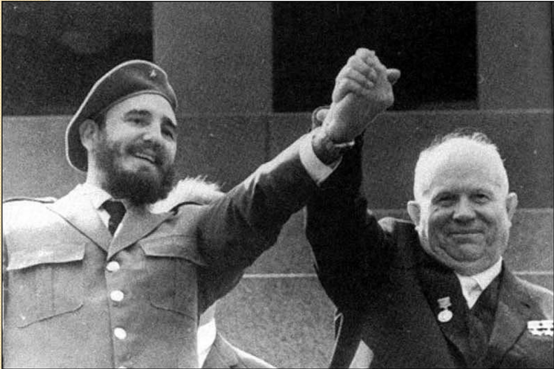
Фидель Кастро в СССР. 1963 г.