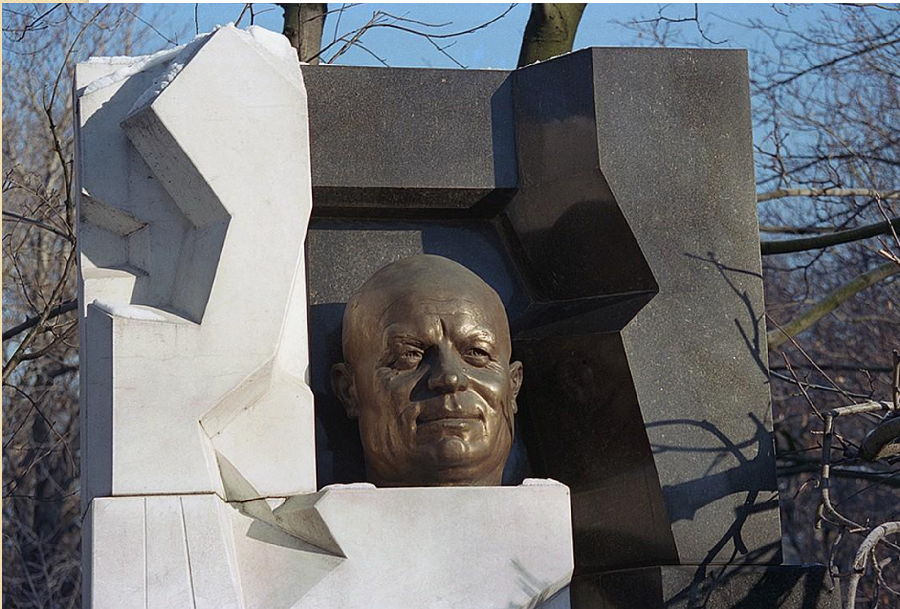
Памятник Н. С. Хрущеву работы Эрнста Неизвестного