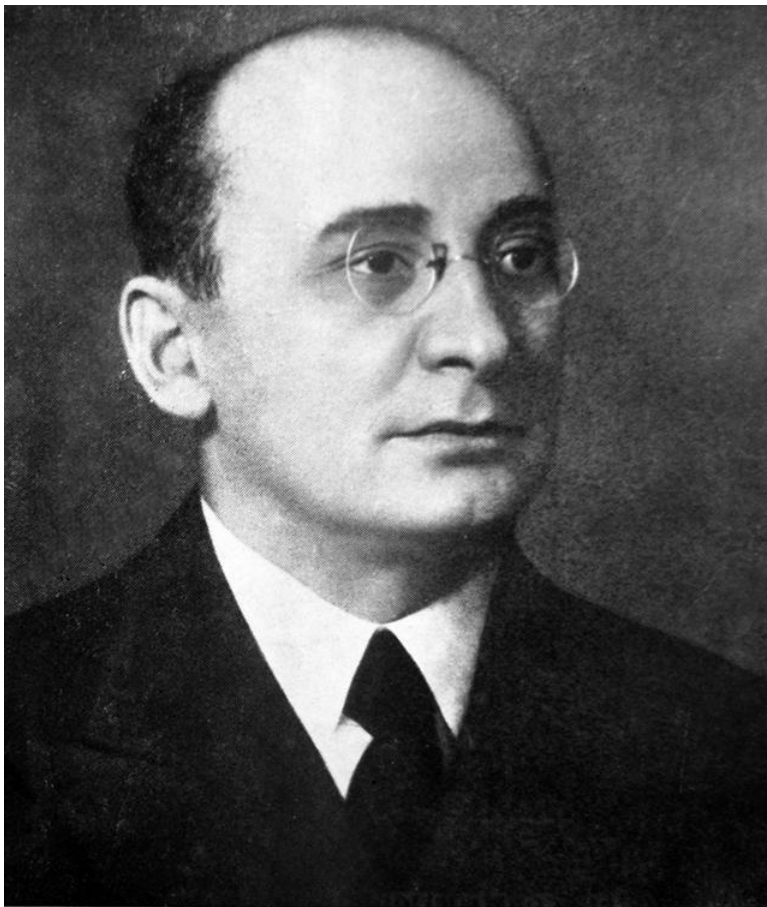
Берия Лаврентий Павлович, 29.03.1899 – 23.12.1953