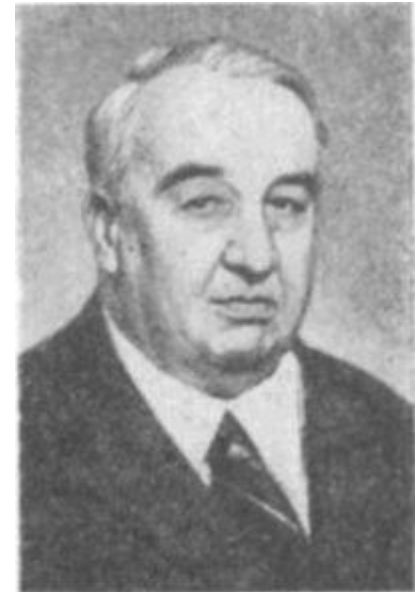
Л. В. Черепнин.

Л.В.Черепнин предложил такое решение проблемы авторства данного документа. Он предполагал, что активное участие в создании Судебника принимали: