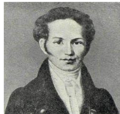
К. Ф. Калайдович