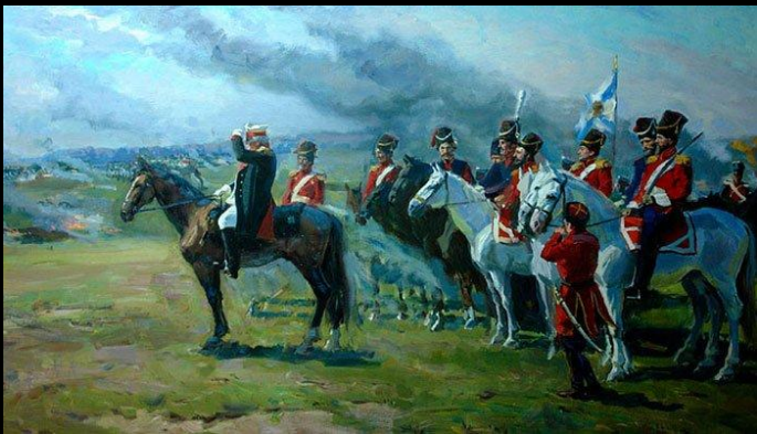
Михаил Илларионович Кутузов