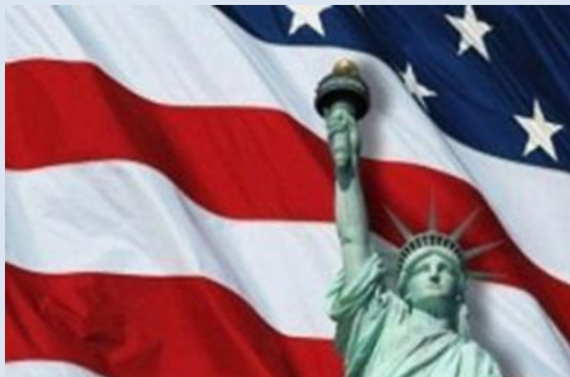
США (Соединённые Штаты Америки)