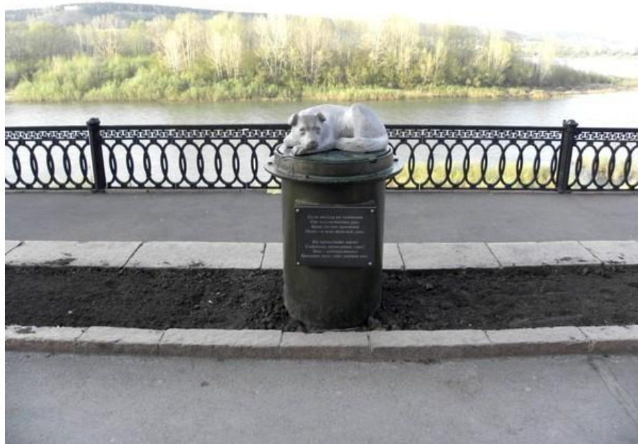
Скульптурная композиция «Собака»

Это – недопустимо: Бросать тех, кто любит нас."