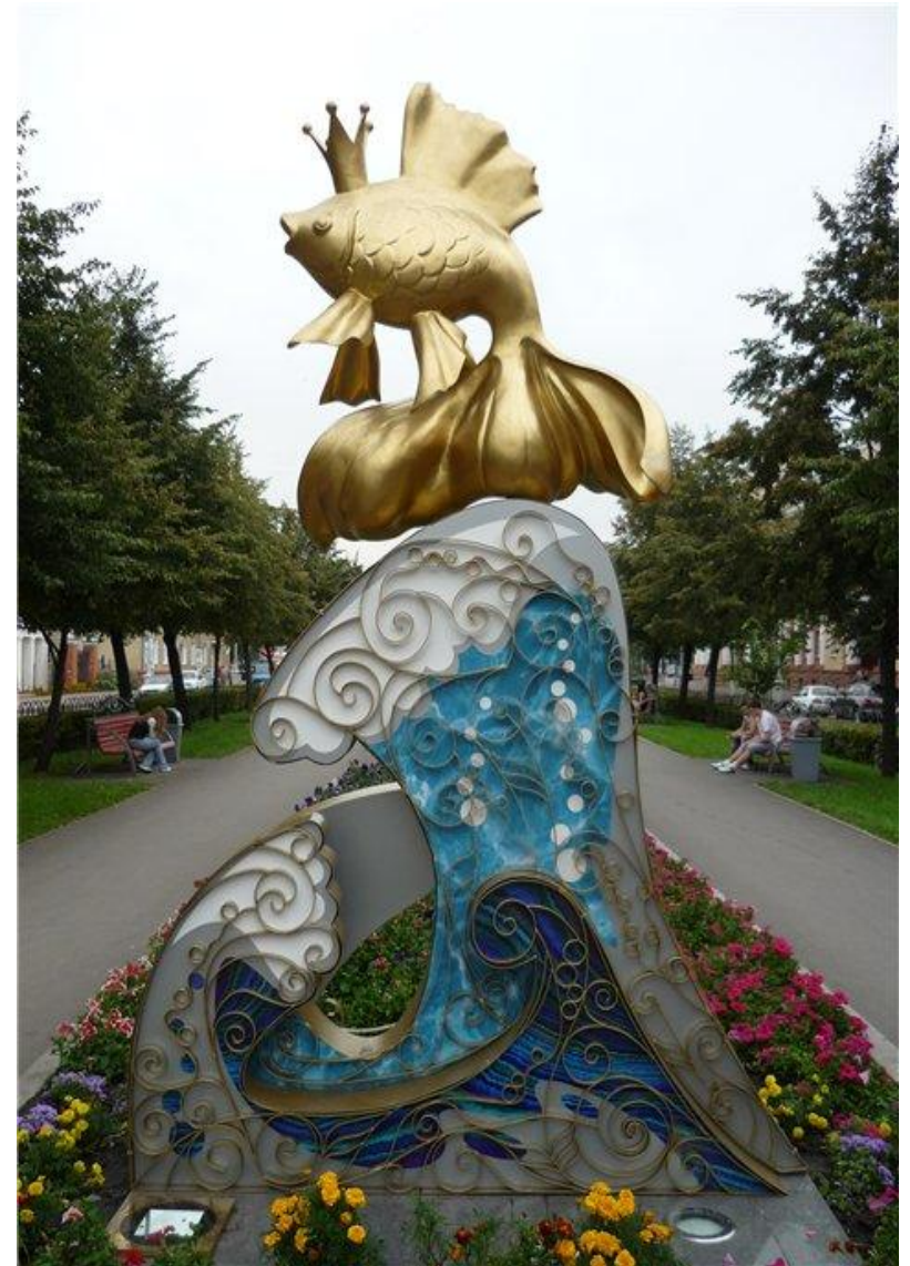
ПАМЯТНИК ЗОЛОТОЙ РЫБКЕ

Памятник Золотой рыбке сразу оброс суевериями-если встать рядом с памятником, загадать желание и потерять хвост или бочок Золотой рыбки, то желание исполнится.