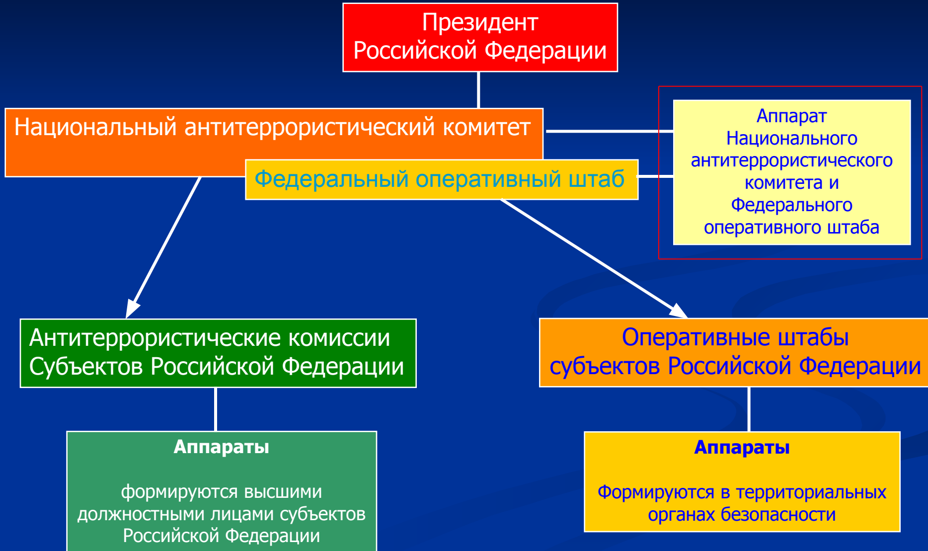
Схема координации деятельности по противодействию терроризму в Российской Федерации