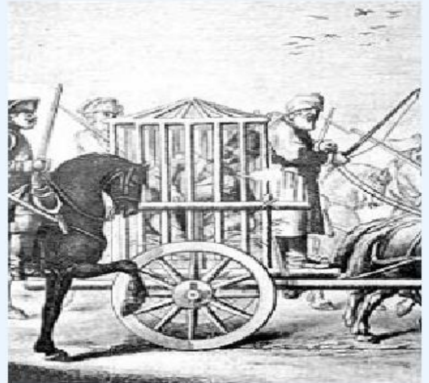
Пугачева в деревянной клетке везут в Москву