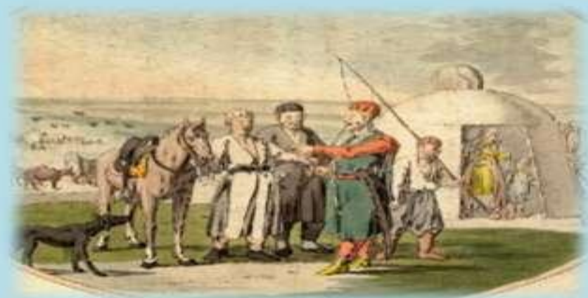
Татары, башкиры и др. нерусские народы России