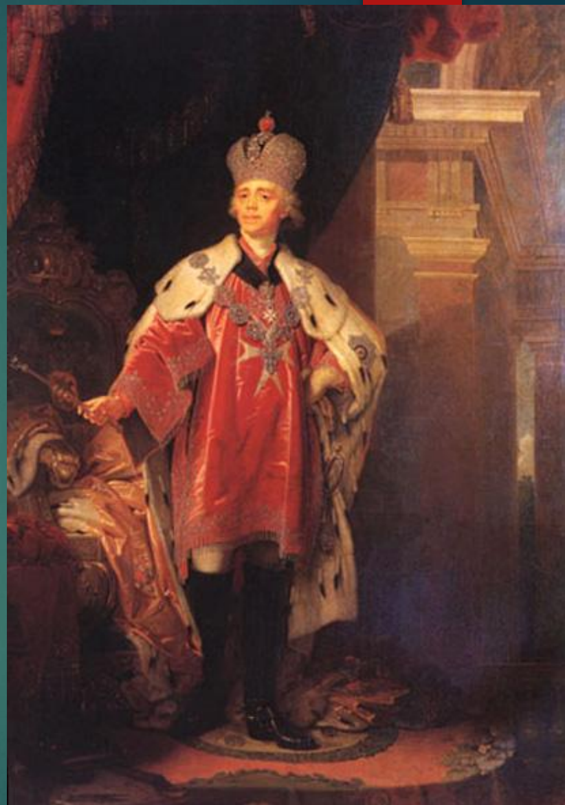
Портрет Павла I в коронационном облачении