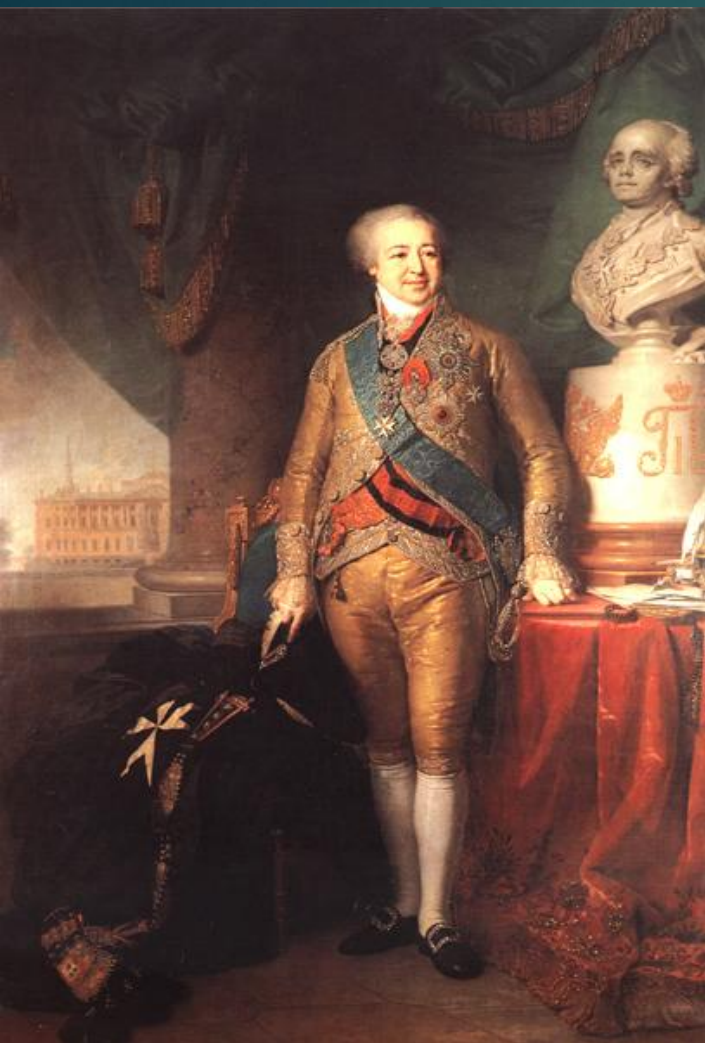
Портрет А. Б. Куракина в одеянии кавалера Мальтийского ордена

Примером блестящего парадного изображения человека служит портрет А. Б. Куракина , передающий всю значительность общественного положения "бриллиантового князя".