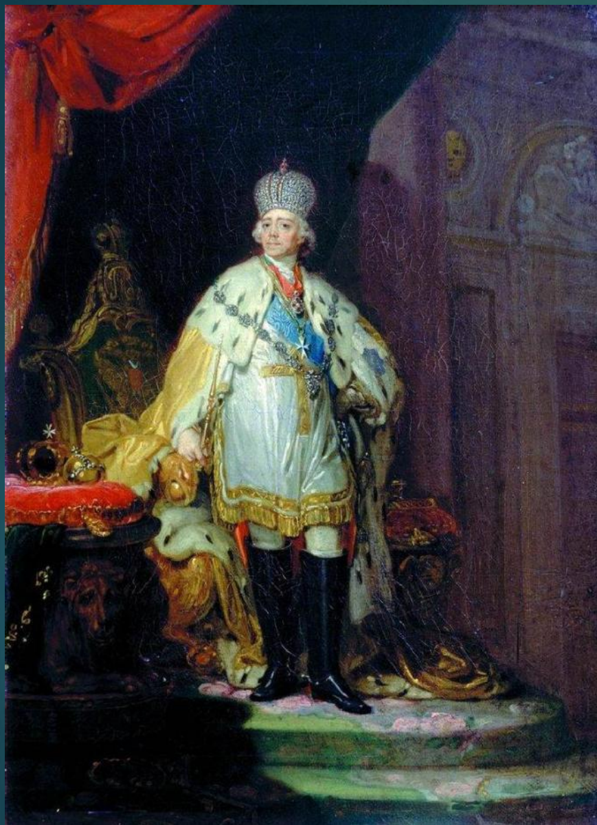
Портрет Павла I в белом далматике