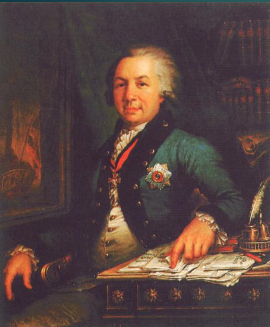
Портрет поэта Г.Р.Державина

Художник запечатлел энергичного державного мужа, сенатора, члена Российской академии и прославленного поэта — человека, увлеченного общественными делами, просветительскими идеалами и творчеством.