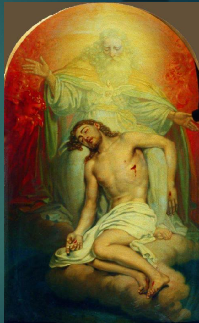
Бог-отец, созерцающий мертвого Христа