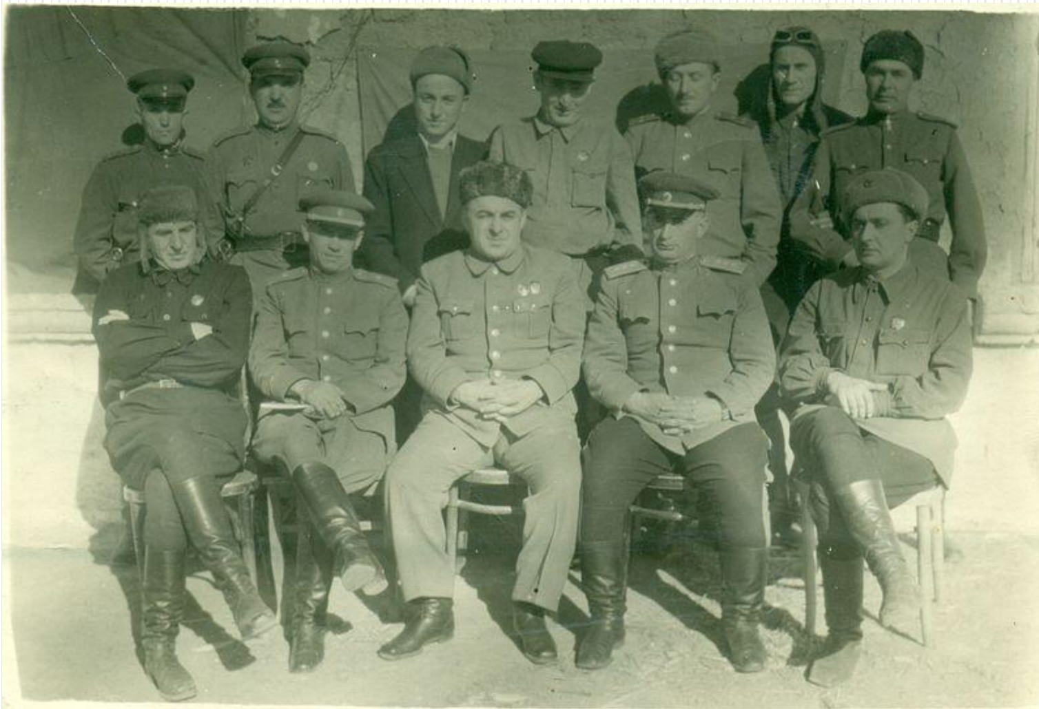
Делегация трудящихся Грузии в 18-й армии. Начальник политотдела 18-й армии Л. И. Брежнев в верхнем ряду, крайний справа.