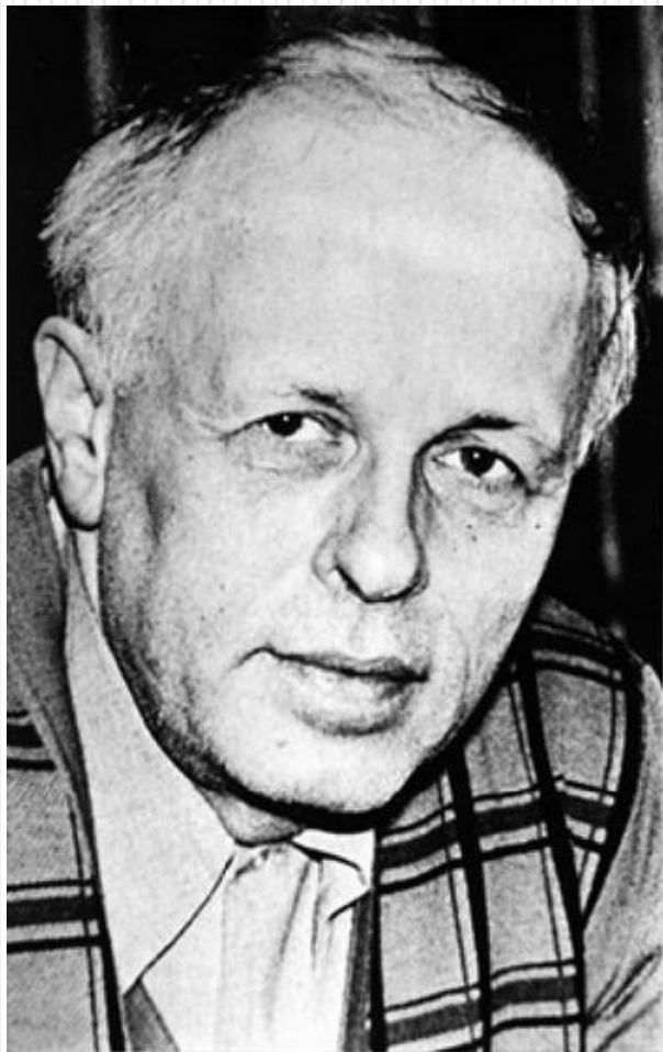
Андрей Дмитриевич Сахаров (1921 – 1989 гг.)