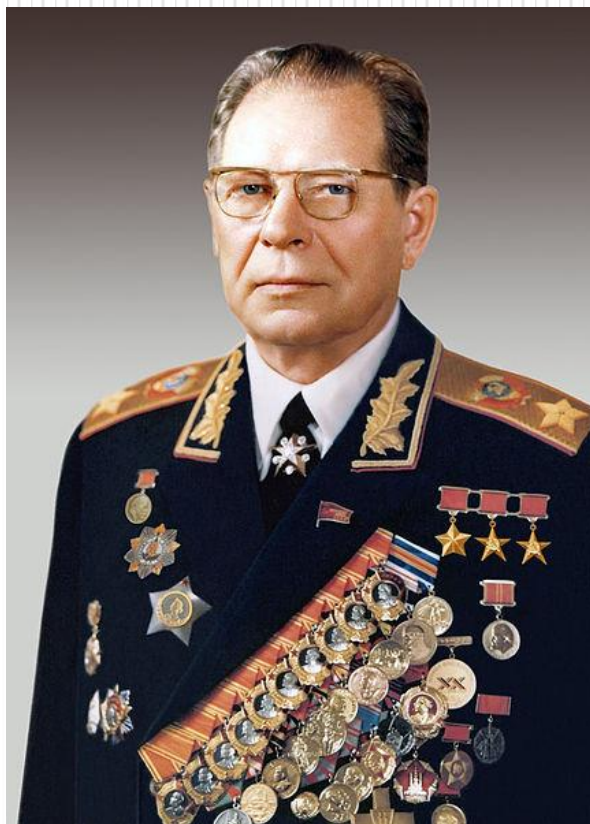
Д.Ф. Устинов – министр обороны СССР (1976 – 1984 гг.)