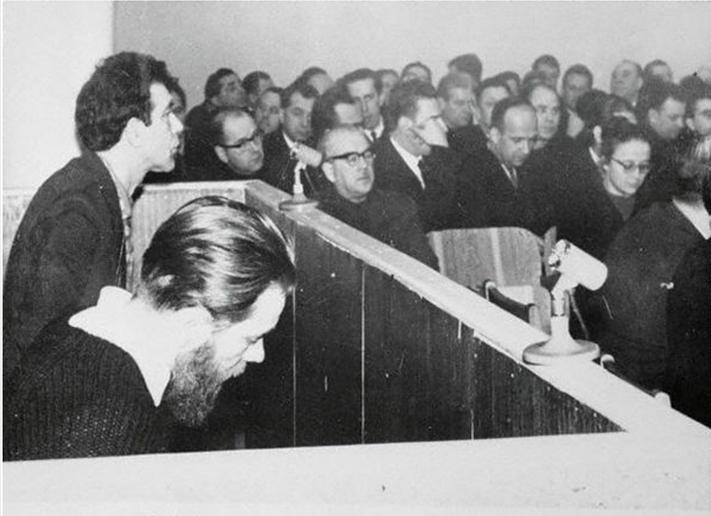
Ю. Даниэль и А. Синявский в зале суда