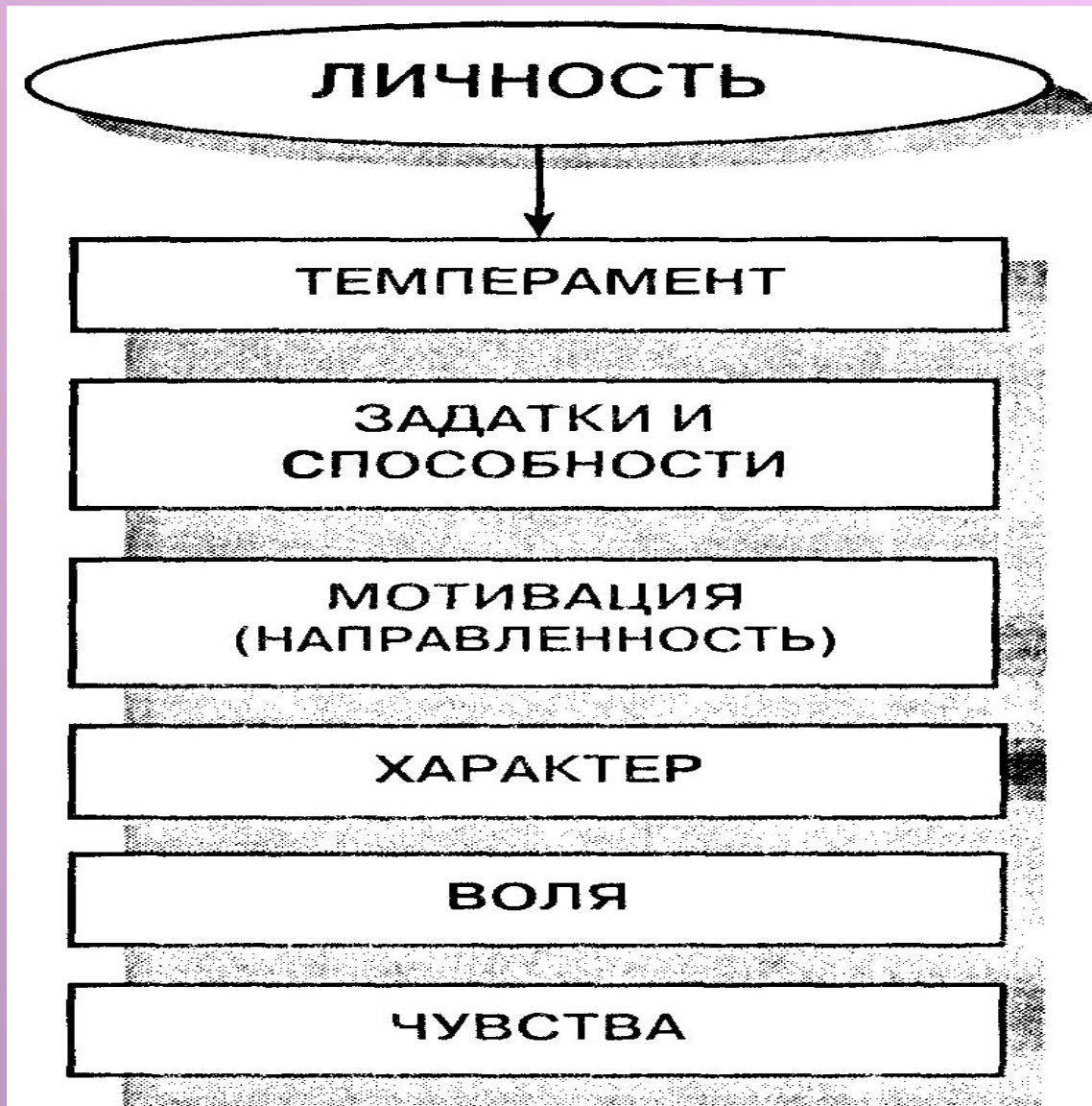
Рис. 1.2. Структура понятия - «личность» (по Б. Г. Ананьеву)