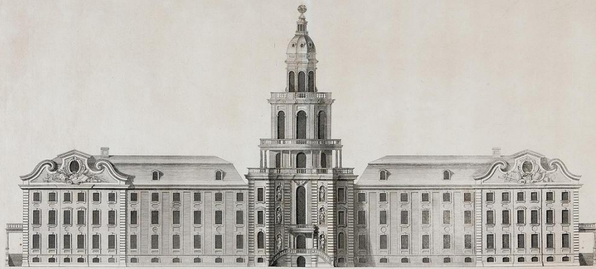
Восточный фасад здания Императорской библиотеки и Кунсткамеры. 1741 год Государственный Эрмитаж, Санкт-Петербург

Первая в России публичная библиотека (современная Библиотека Академии наук) была сформирована в 1714 году, одновременно с Кунсткамерой. Однажды Петру предложили установить в этих заведениях плату за вход — по примеру других европейских стран. Но там и так было мало посетителей — жители Петербурга понятия не имели, зачем им ходить в библиотеку или в музей. Поэтому Петр приказал «не только всякого пускать туда даром, но, если кто придет с компаниею смотреть редкости, то угощать их за мой счет чашкою кофе, рюмкою вина или водки, либо чем-нибудь иным, в самых этих комнатах». Для исполнения этого приказа библиотека ежегодно получала 400 рублей на угощение посетителей.