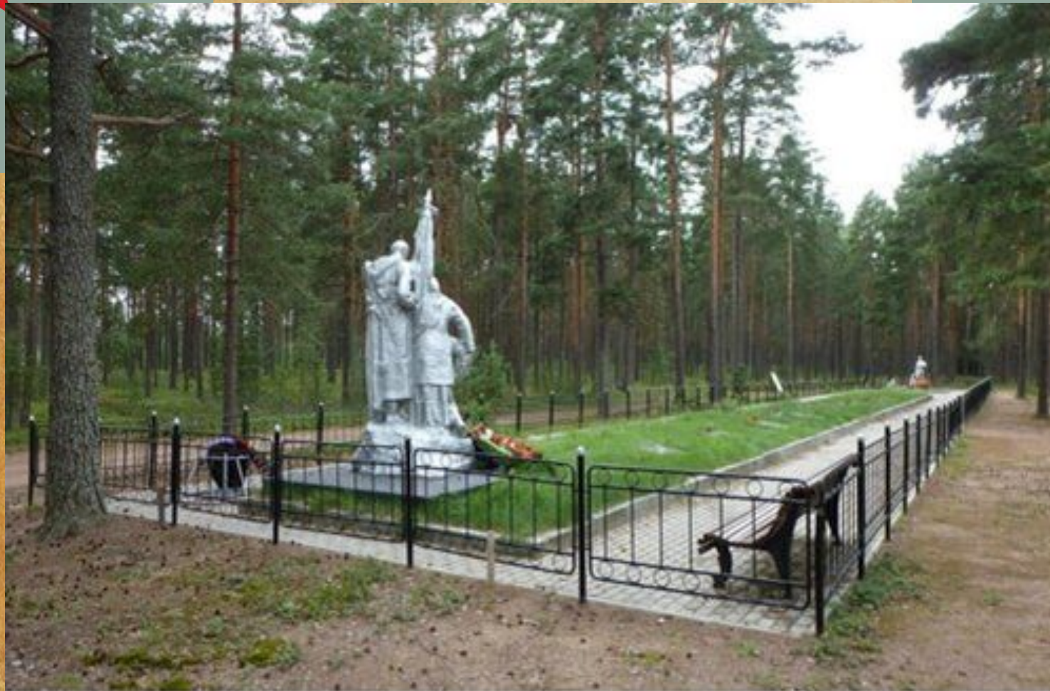
Захоронение № 54, г. Высоцк, остров Высоцкий