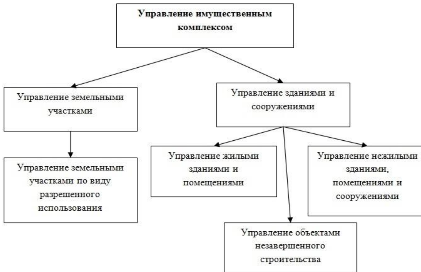
Рис. Объектная система управления имуществом комплексом

На рисунке 2 представлена общая схема управления имуществом комплексом: