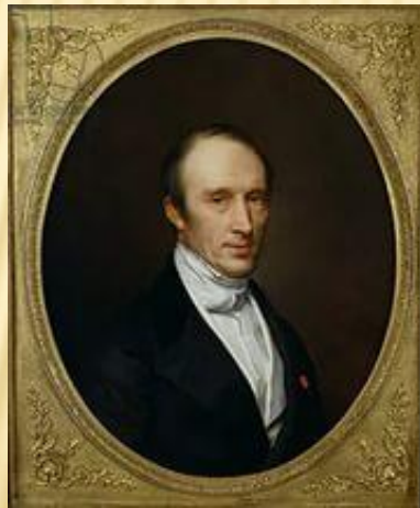
Французский математик и механик Огюстен Луи Коши

Для того, чтобы последовательность имела конечный предел, необходимо и достаточно, чтобы для каждого положительного числа \varepsilon существовал такой номер N_0(\varepsilon) , чтобы неравенство |x_n - x_{n+p}| < \varepsilon выполнялось для всех n > N_0 и p \geq 1