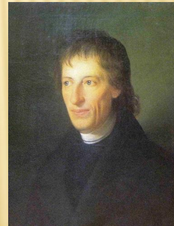
Чешский математик и философ Бернард Больцано