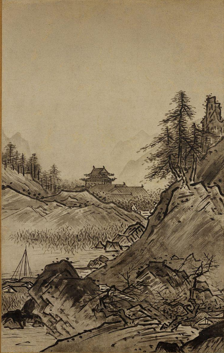
Сэсю. Осенний пейзаж