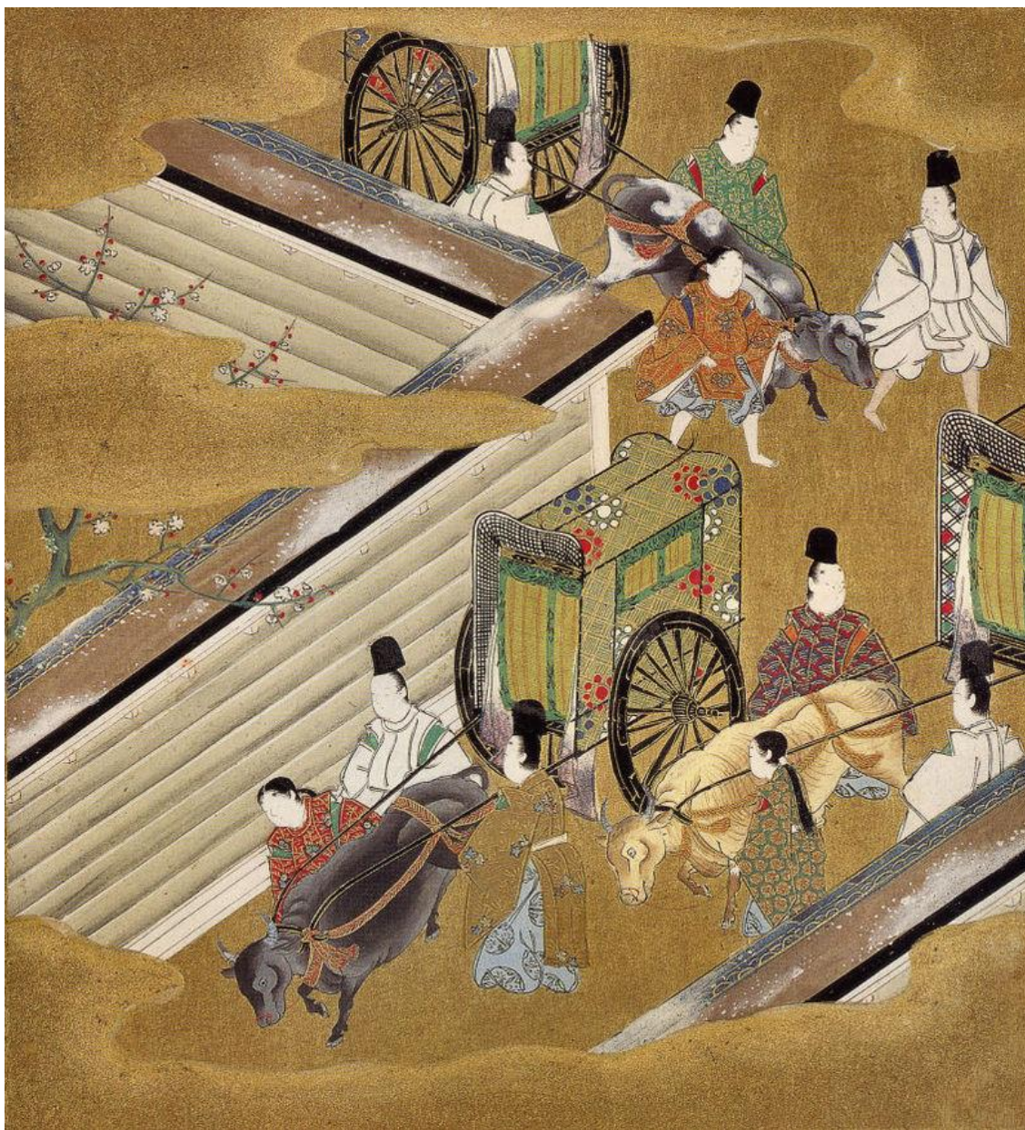
Иллюстрация к Гэндзи-моногатари, приписывается Тоса Мицуоки (1617-1691)