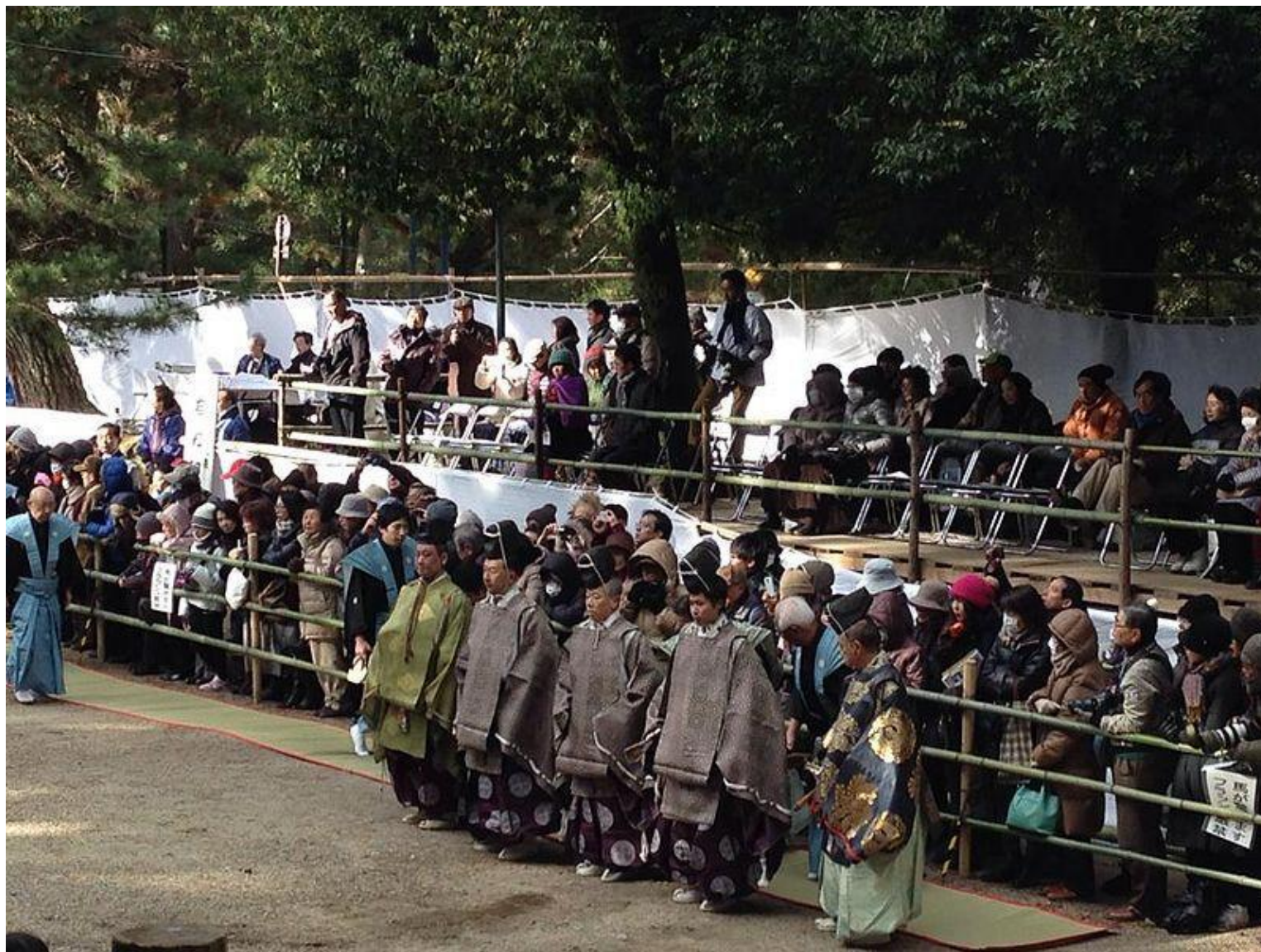
Труппа саругаку на мацури в храме Касуга тайся в Наре