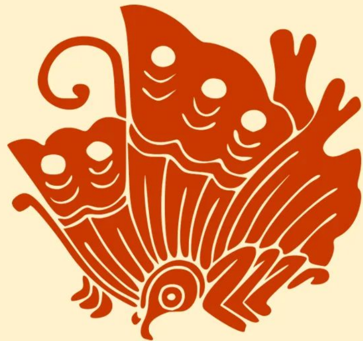
平氏：揚羽蝶の家紋