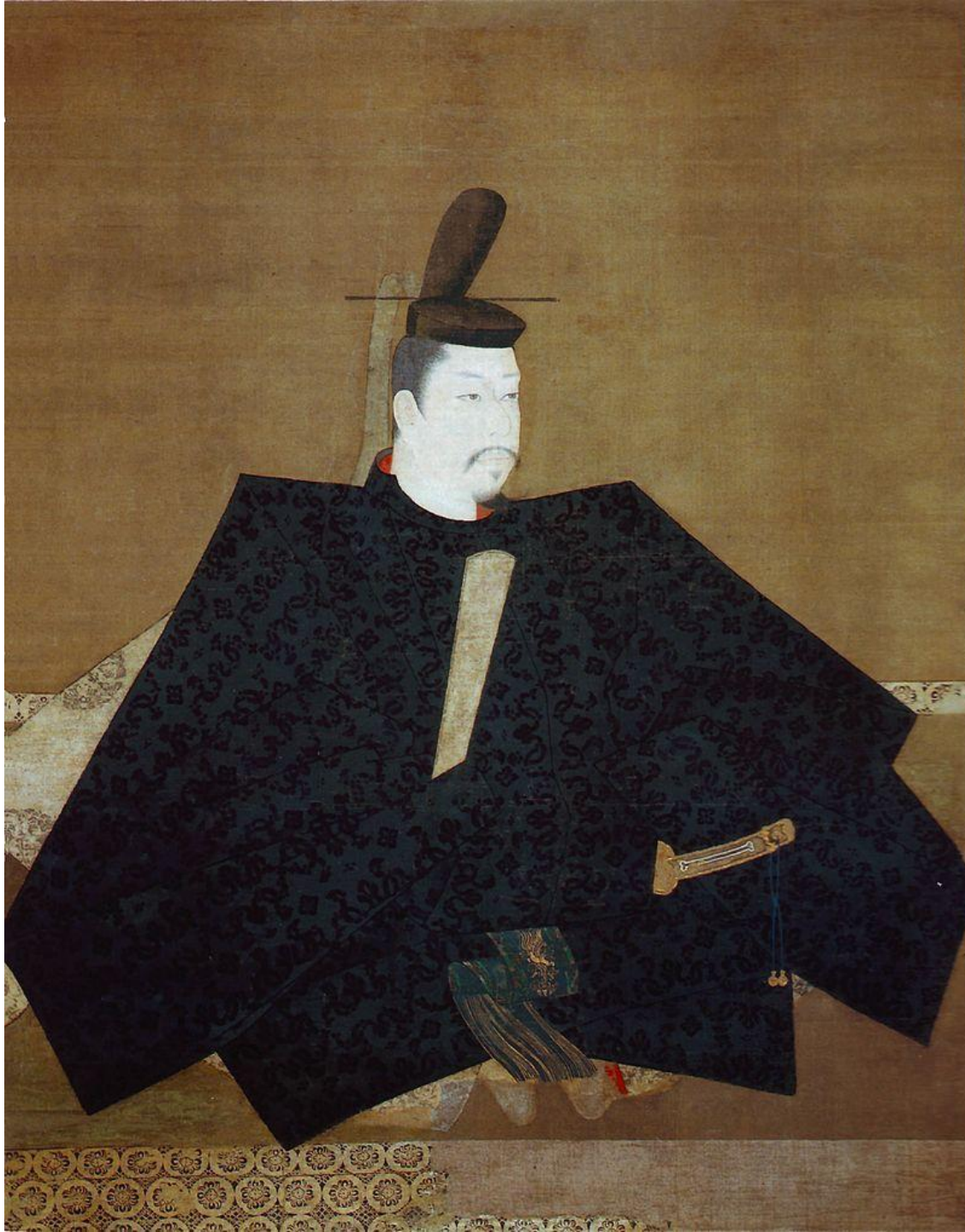
Портрет Минамото но Ёритомо, 1179 г.