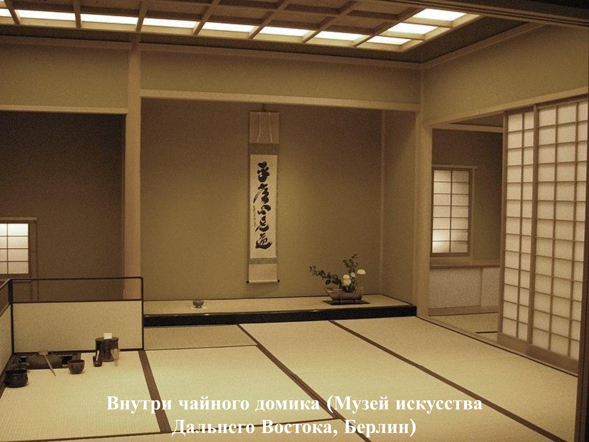
Внутри чайного домика (Музей искусства Дальнего Востока, Берлин)