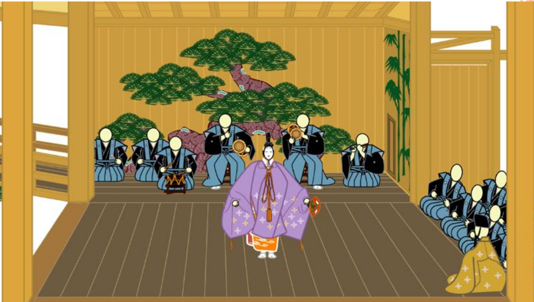
Сцена из спектакля но. Иллюстрация