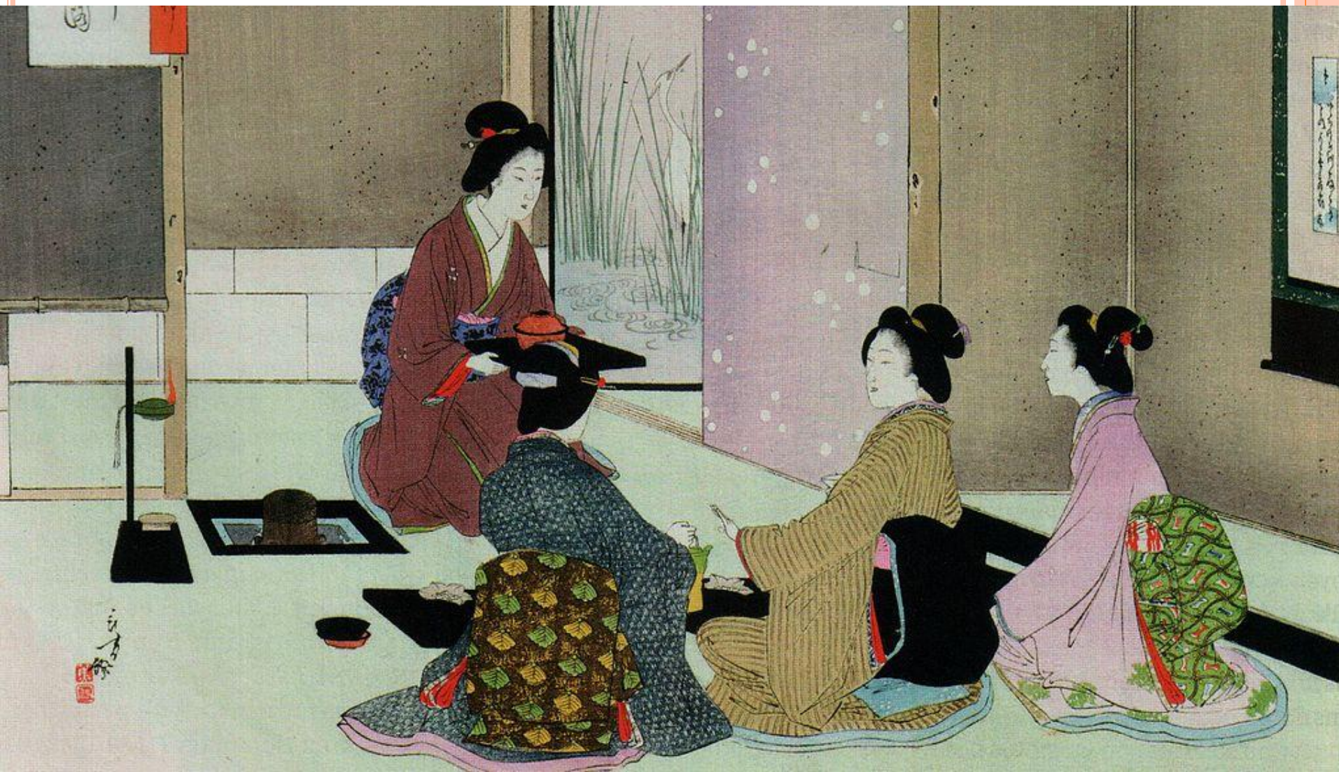
Мидзуно Тосиката. «Место встречи» (из серии «Барвинки чайной церемонии»). XXIX год Мэйдзи (1896). Цветная гравюра на дереве.