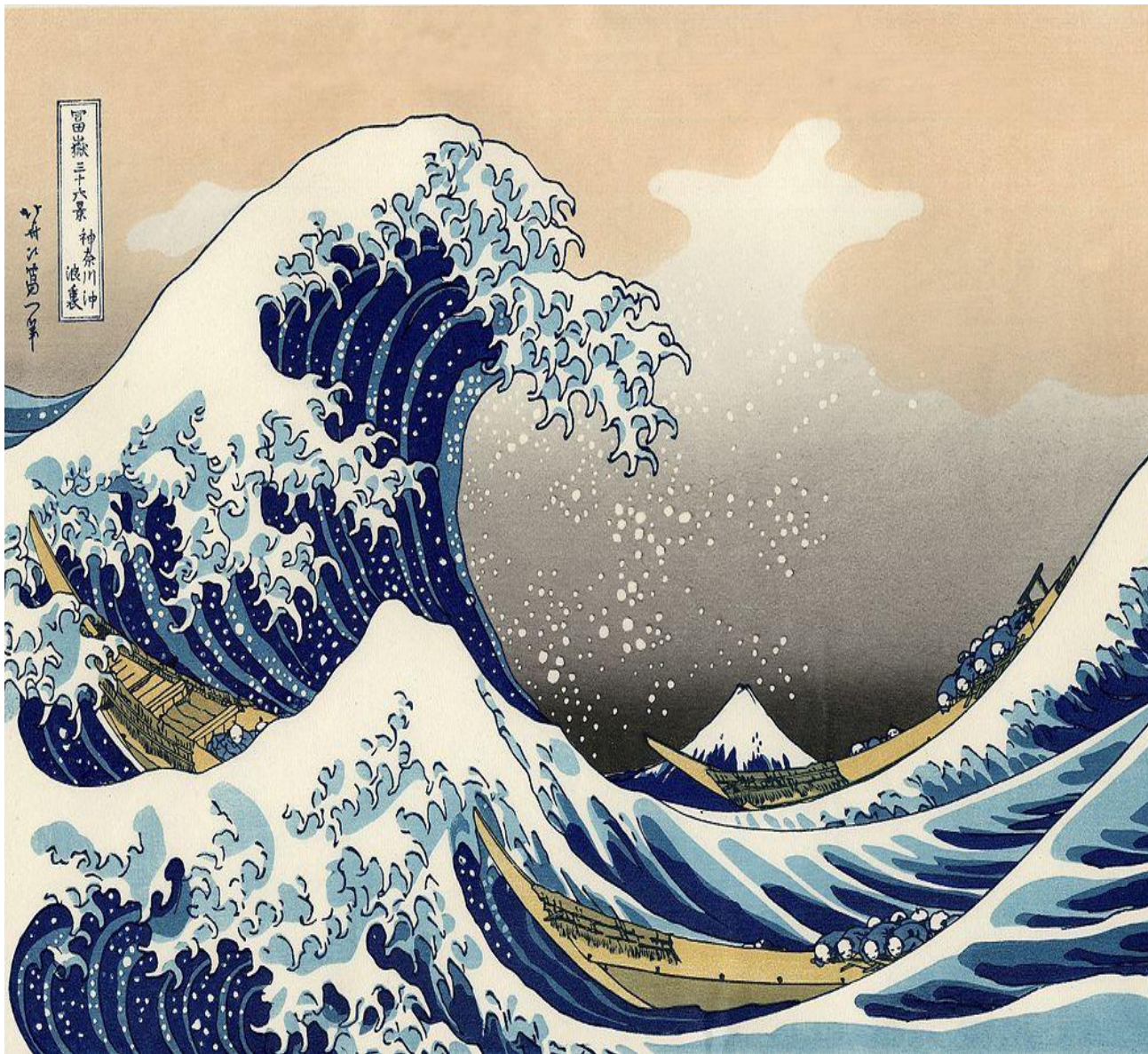
Кацусика Хokusай. Большая волна в Канагаве, 1823-1831