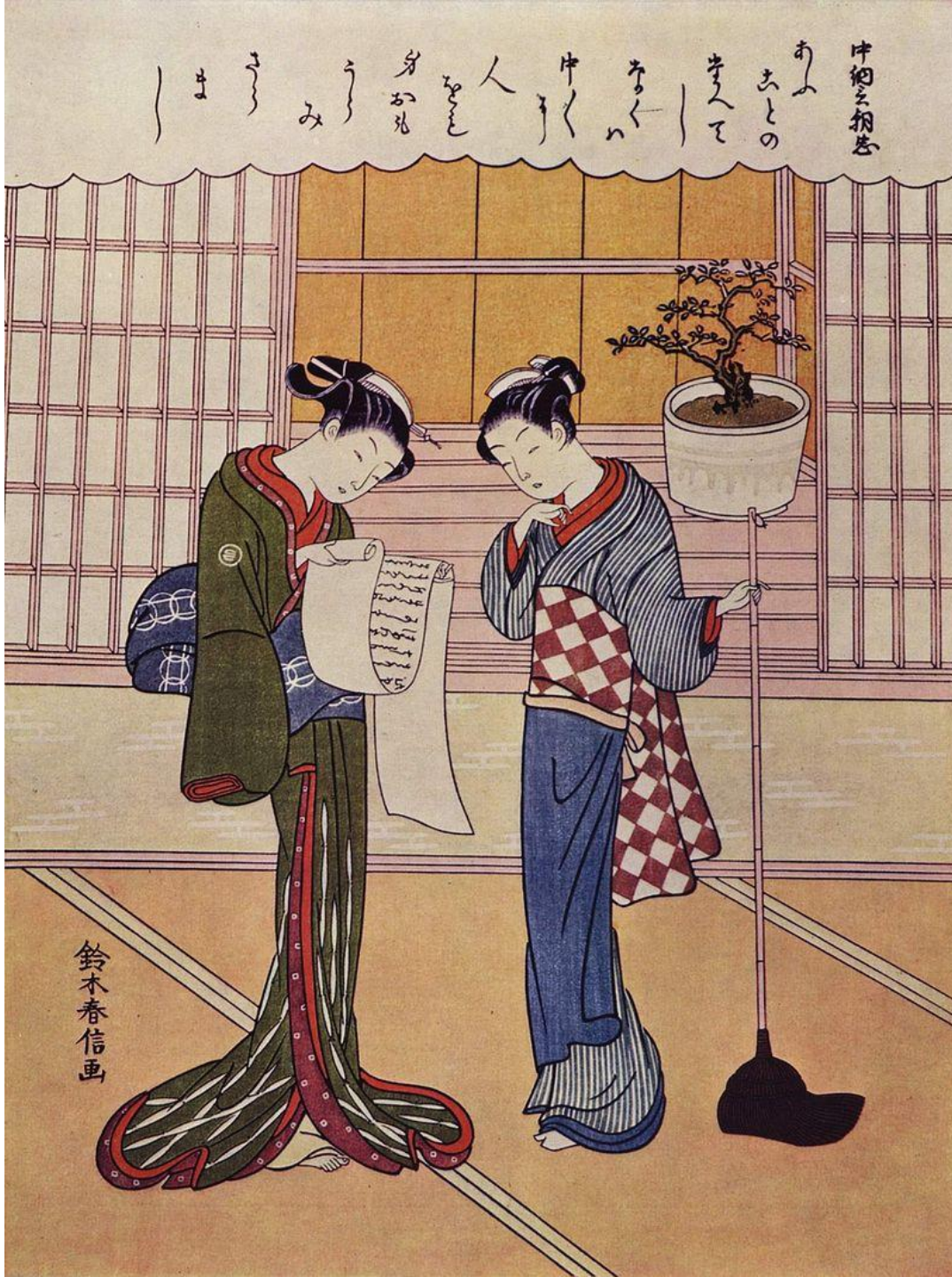
Судзуки Харунобу. «Две женщины на веранде». Цветная гравюра на дереве. Ок. 1750.