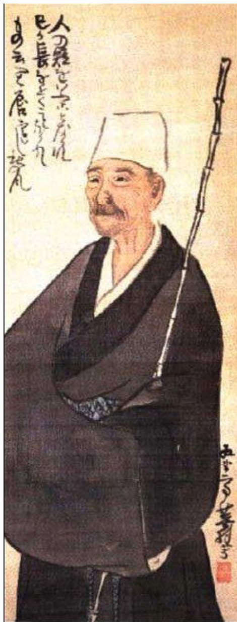
Портрет Басё работы Ёсы Бусона