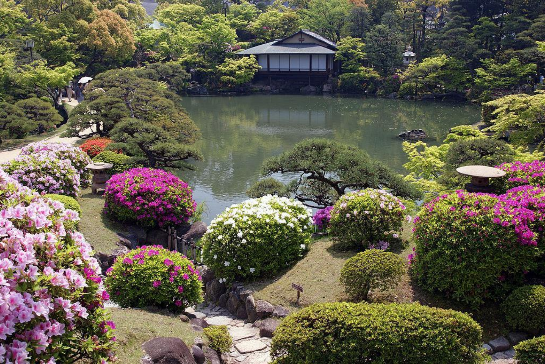
Чайный домик Энсинтэй в саду Соракуэн, Кобе, префектура Хёго.