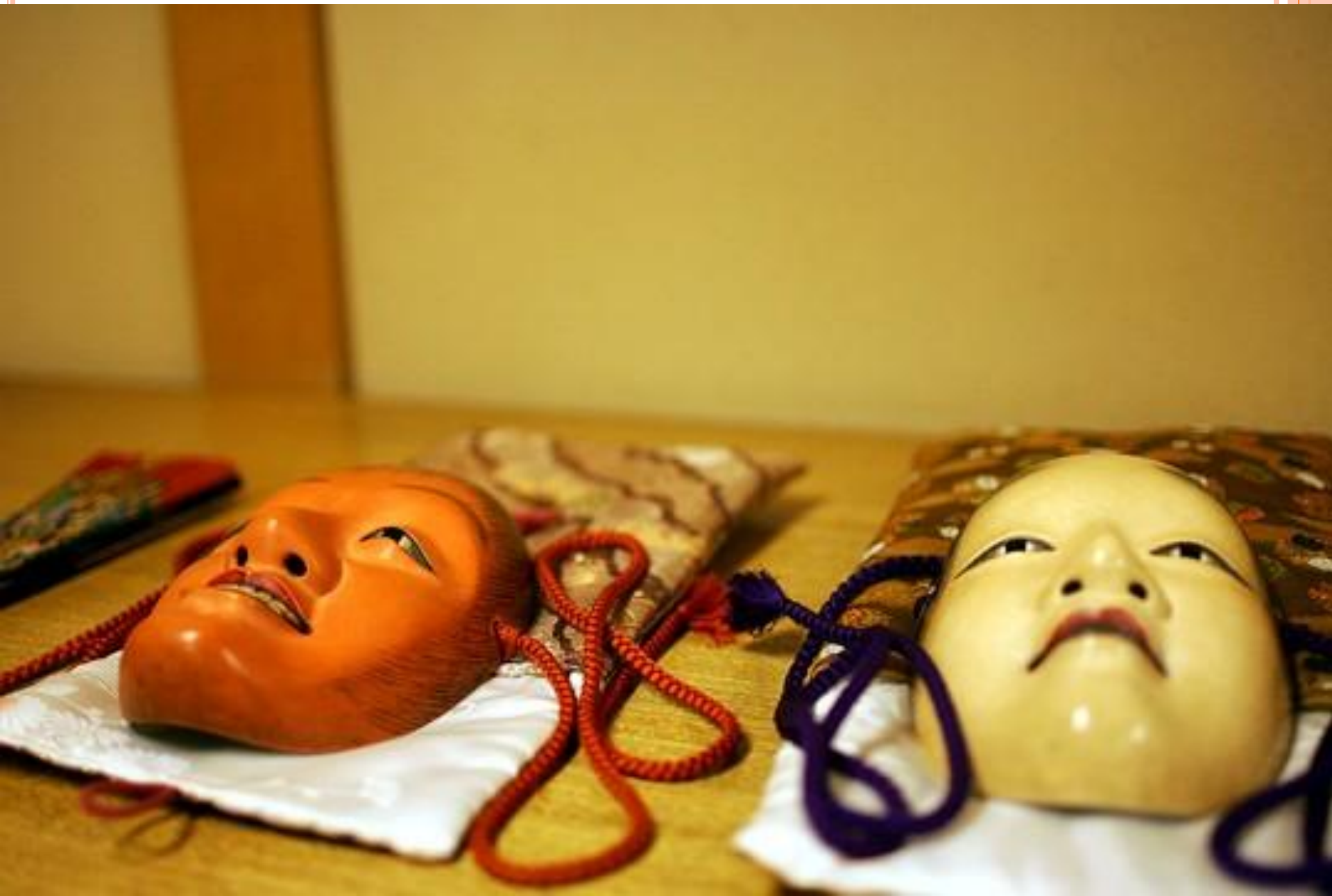
Маски театра но