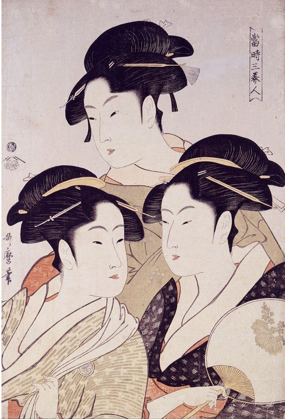
Утамаро. Три знаменитые красавицы