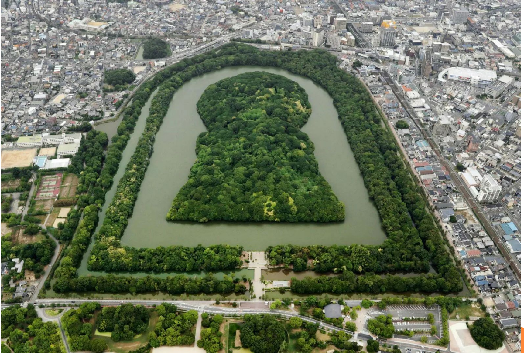
Курган императора Нинтоку