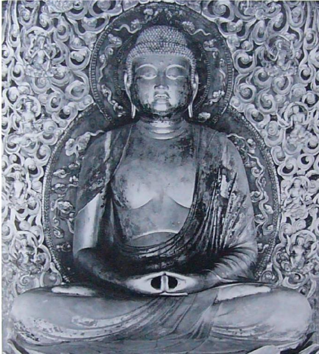
Дзётё. Будда Амида из Бёдо-ина