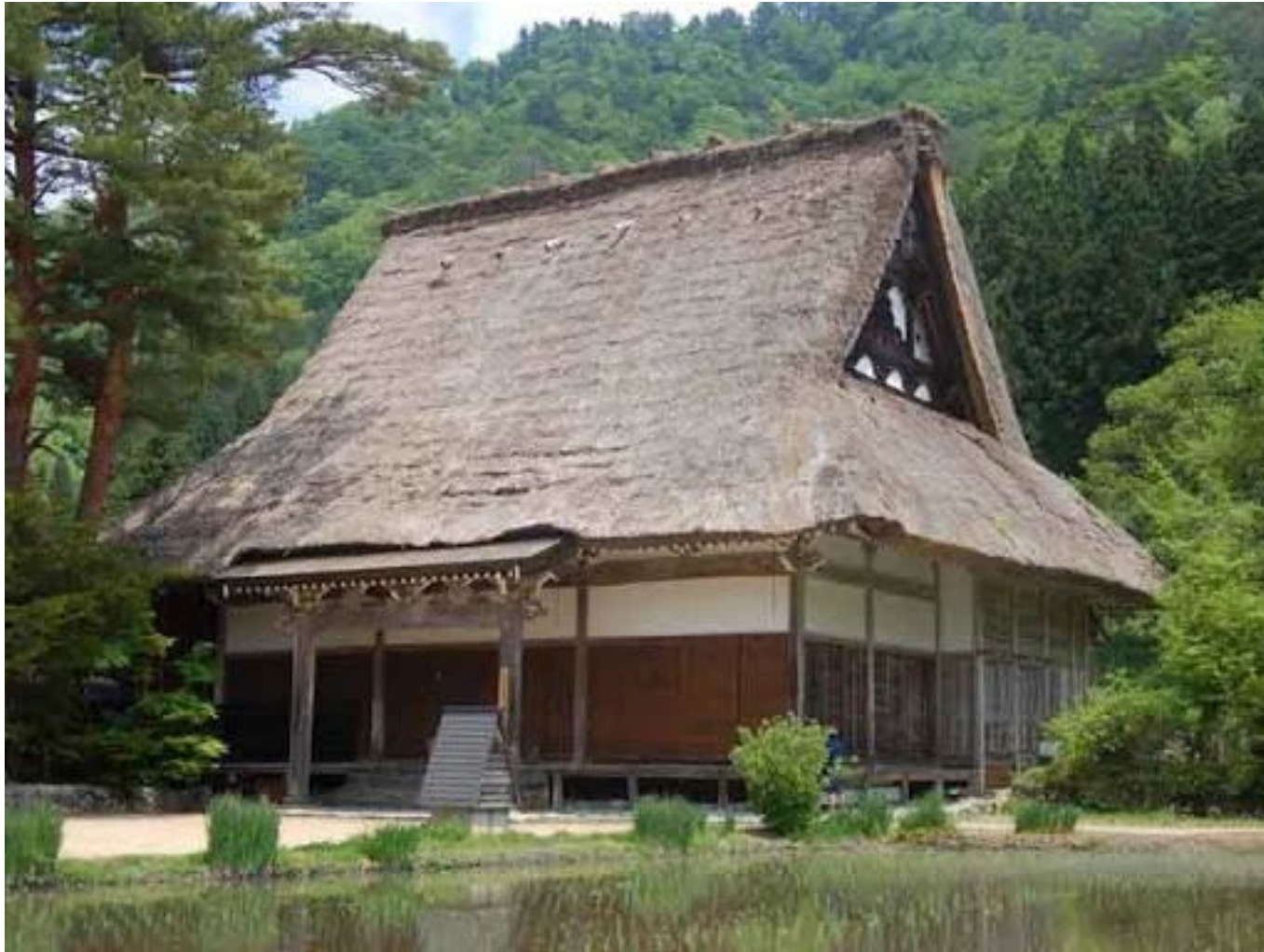
Традиционные японские дома