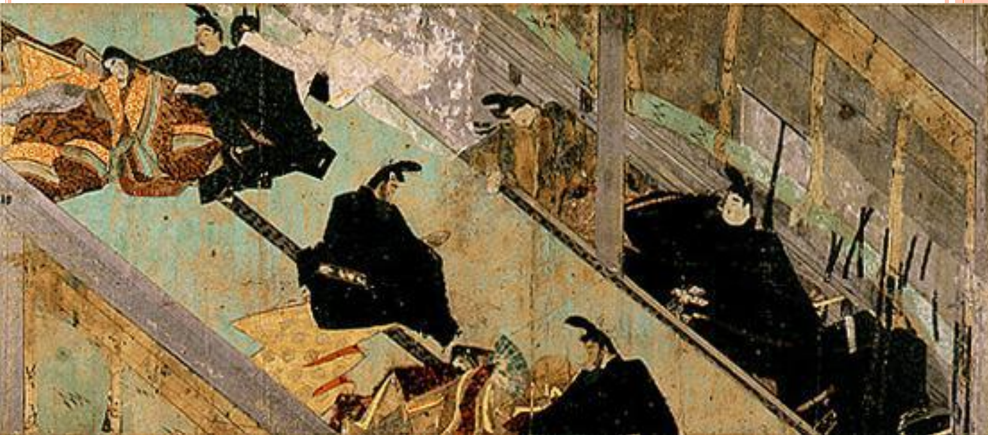
Свиток Фудзивары Нобудзанэ, XIII в.