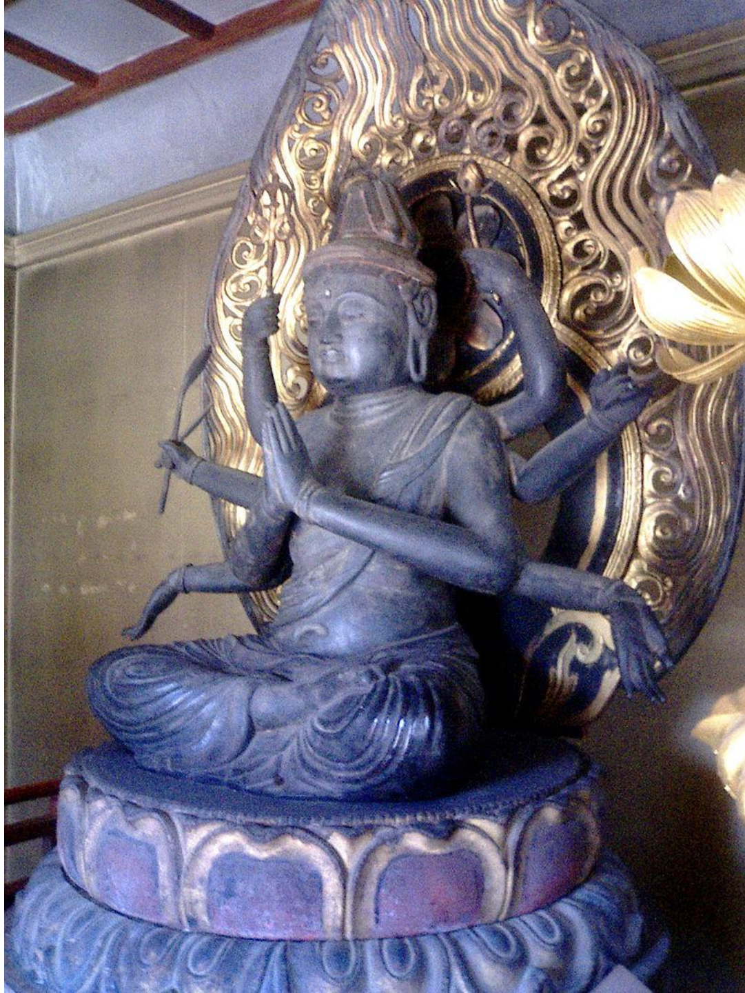
Скульптурное изображение Каннон