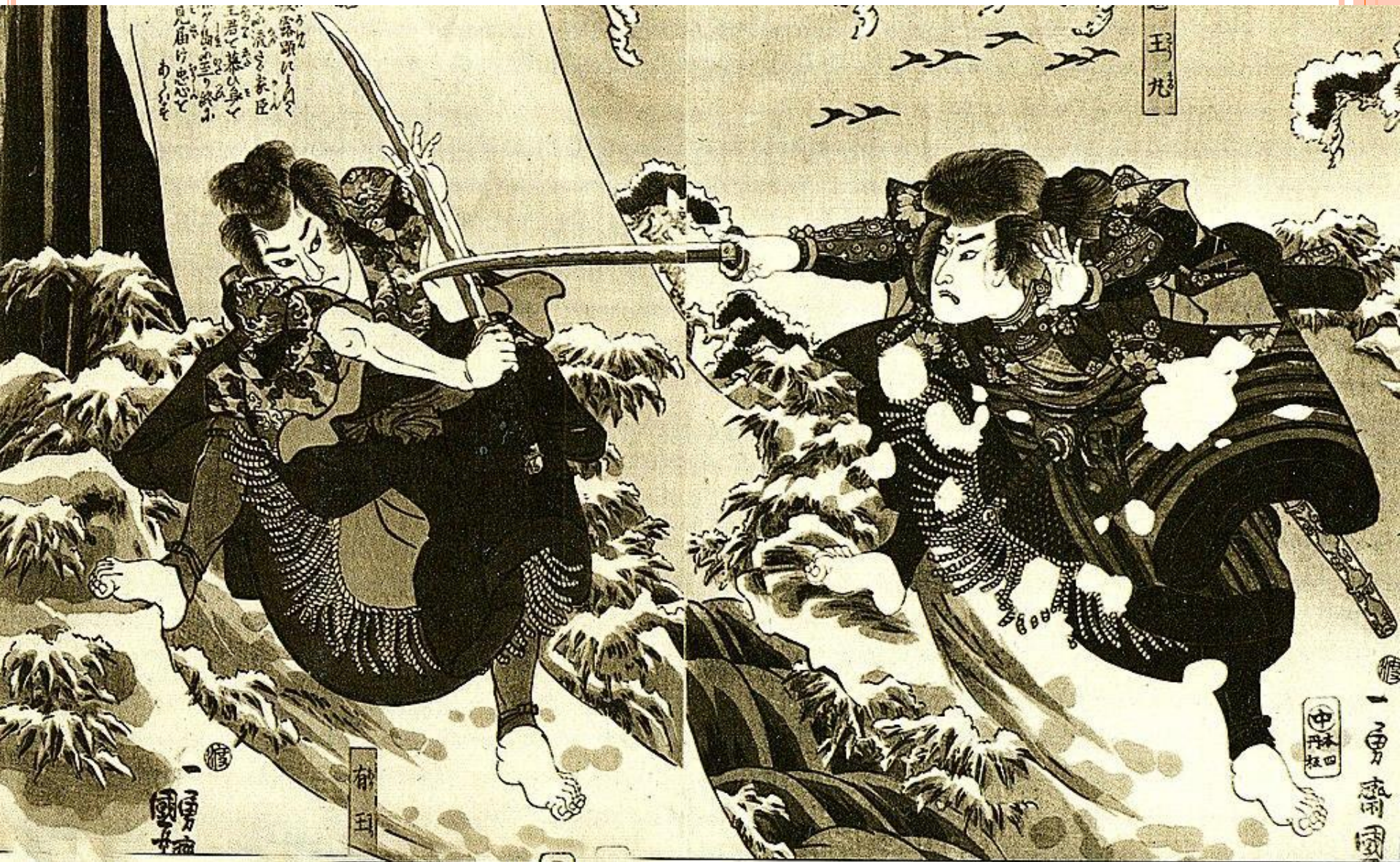
Артисты кабуки изображают бой самураев