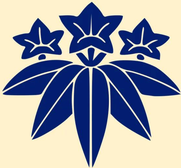
源氏：笹竜胆の家紋