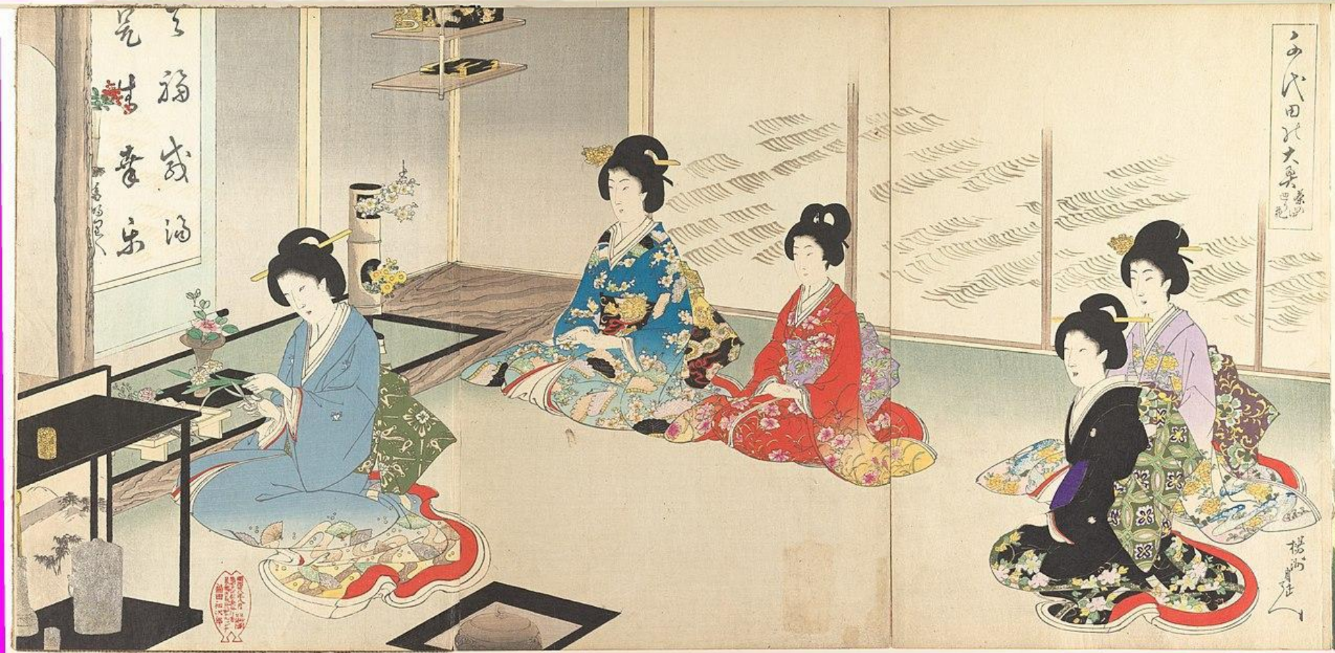
Создание икебаны в Ооку. Хасимото Тиканобу, 1895-1808