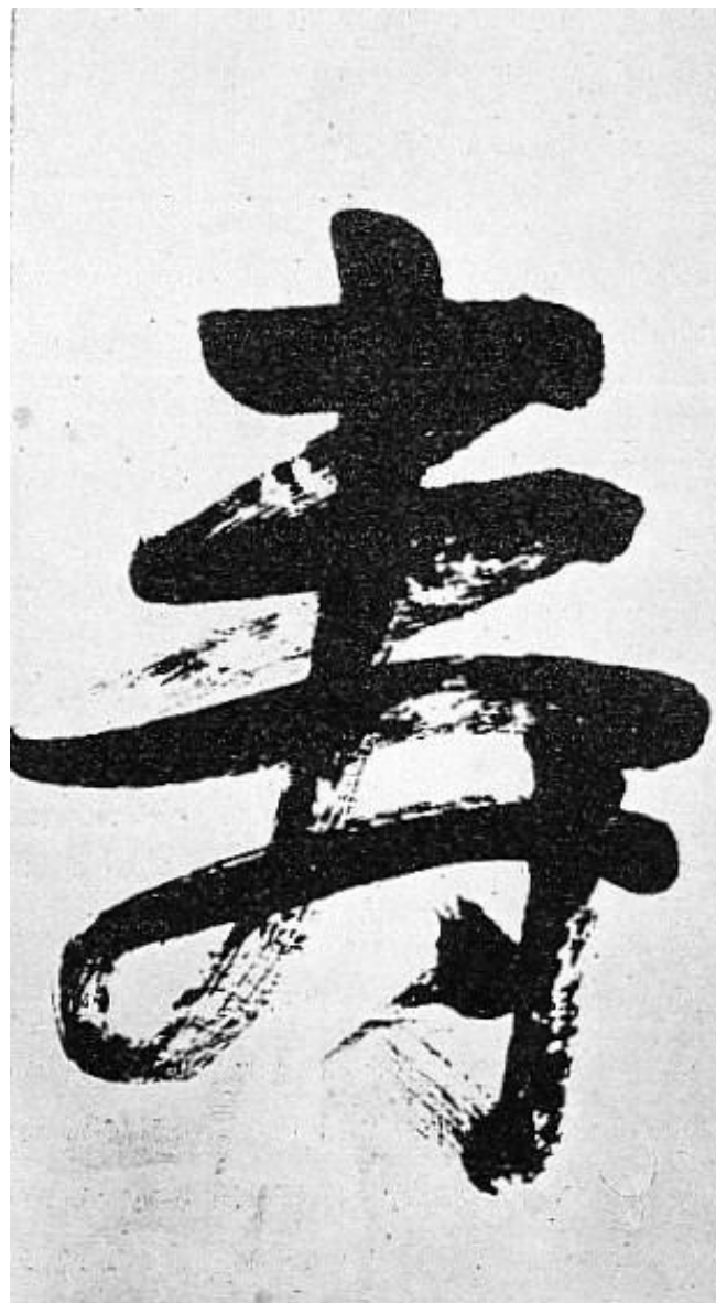
Образец японской каллиграфии