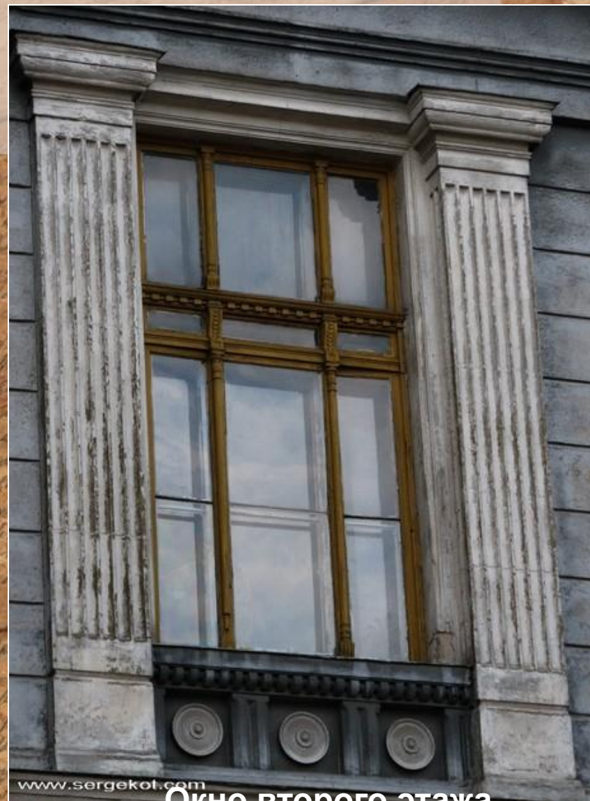
Окно второго этажа