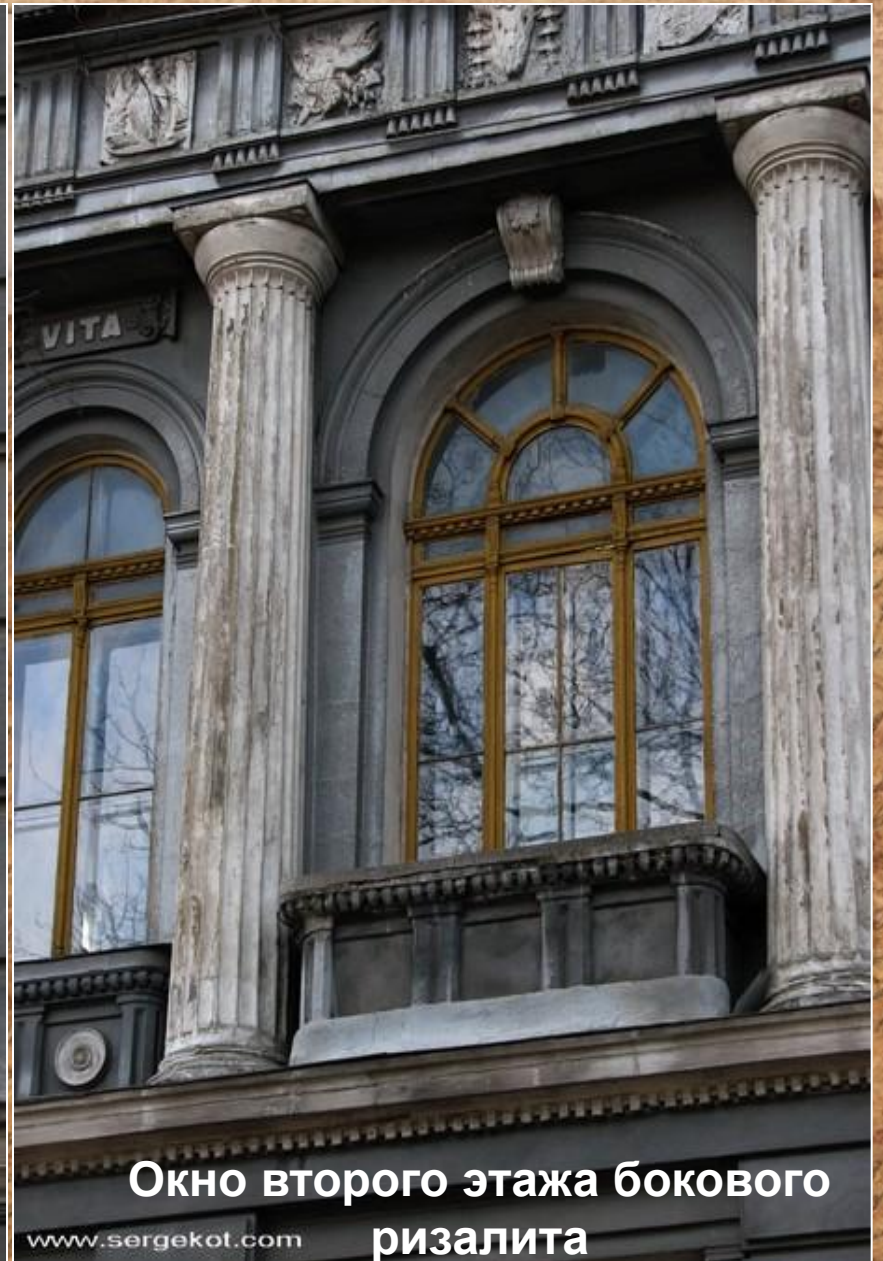
Окно второго этажа бокового ризалита