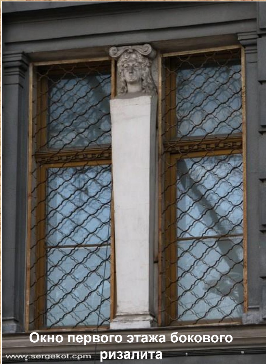
Окно первого этажа бокового ризалита