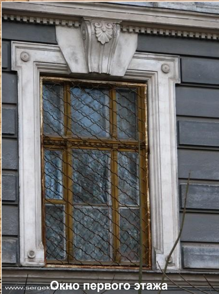
Окно первого этажа