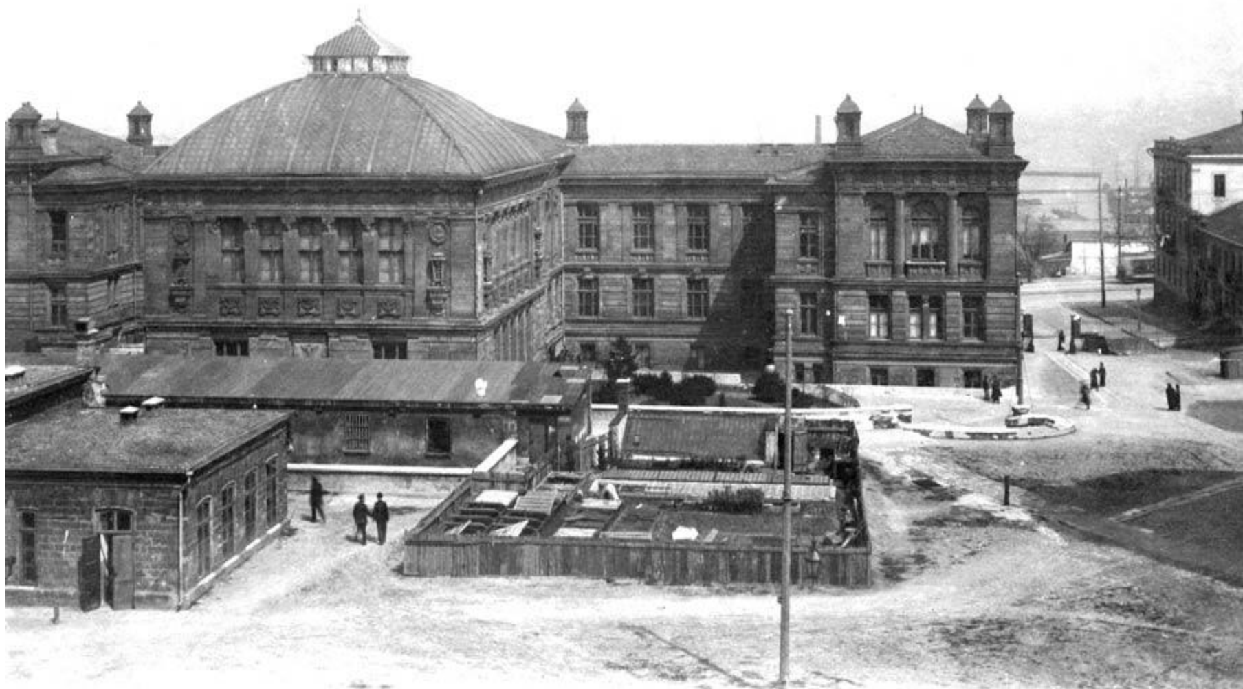
здание в начале XX века