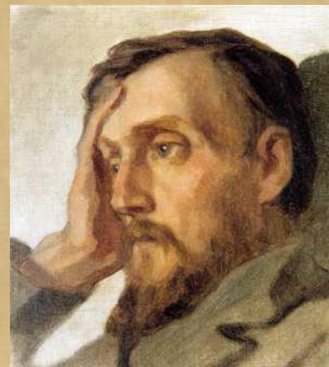
В. Г. Белинский