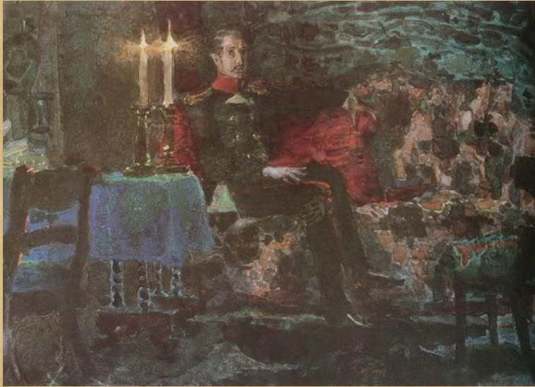
Врубель. «Печорин на диване»

Композиция, сюжет и система образов романа подчинены задаче всестороннего и глубокого раскрытия личности героя.