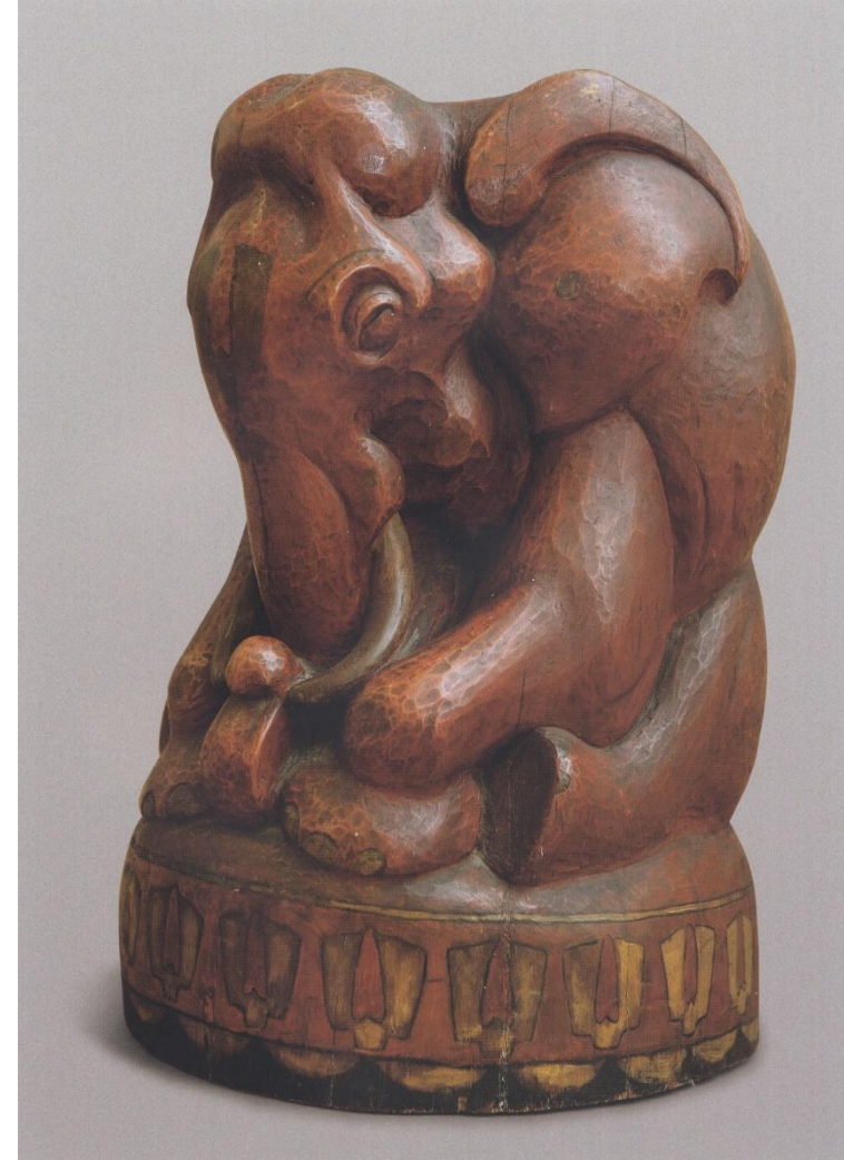
В. А. Ватагин. Красный слон 1915