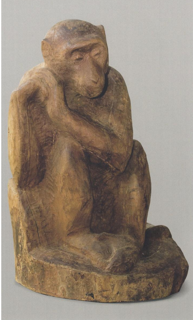
В. А. Ватагин. Печальная обезьяна 1964