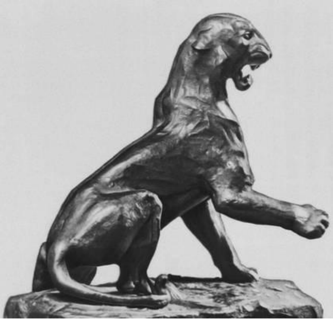
В. А. Ватагин. Тигр 1925-1926

Произведения художника находятся в экспозициях многих музеев, таких как Третьяковская галерея, Русский музей, Национальный исторический музей Республики Беларусь, Львовская галерея искусств, Литовский художественный музей и других. Крупнейшим собранием анималистической живописи, графики и скульптуры художника обладает Государственный Дарвиновский музей.