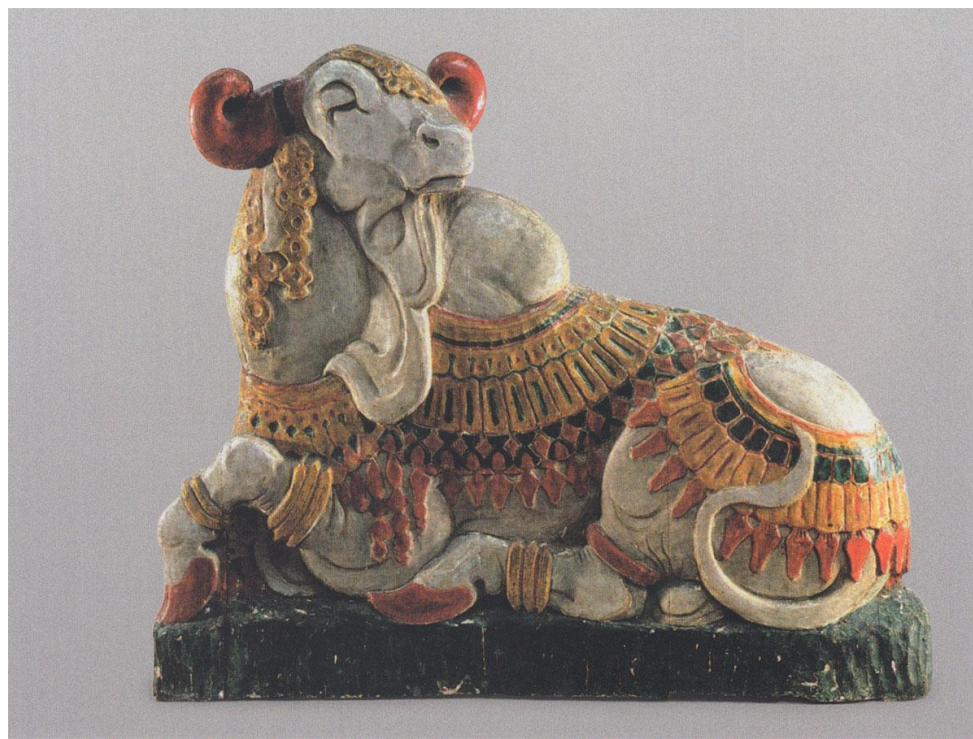
В. А. Ватагин. Бычок 1920