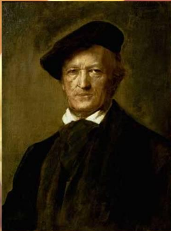
РИХАРД ВАГНЕР. Портрет работы Ф.Ленбаха