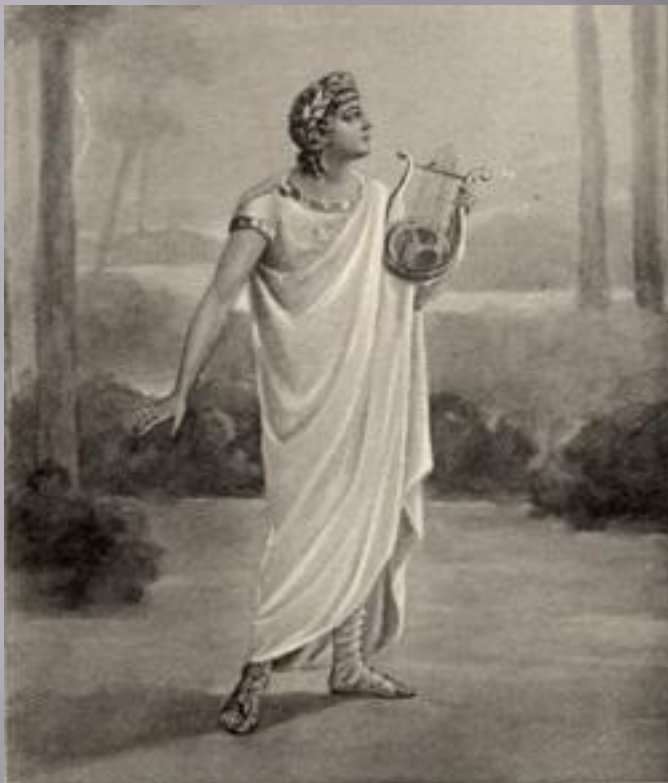
3152. Л. В. СОБИНОВЪ. (Оп. „Орфей и Эвридика“). Фотогр. и худож. фотот. К. А. Фишеръ, Москва. 1912 г.