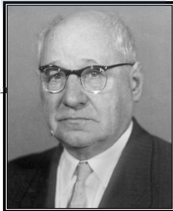
Туполев Андрей Николаевич