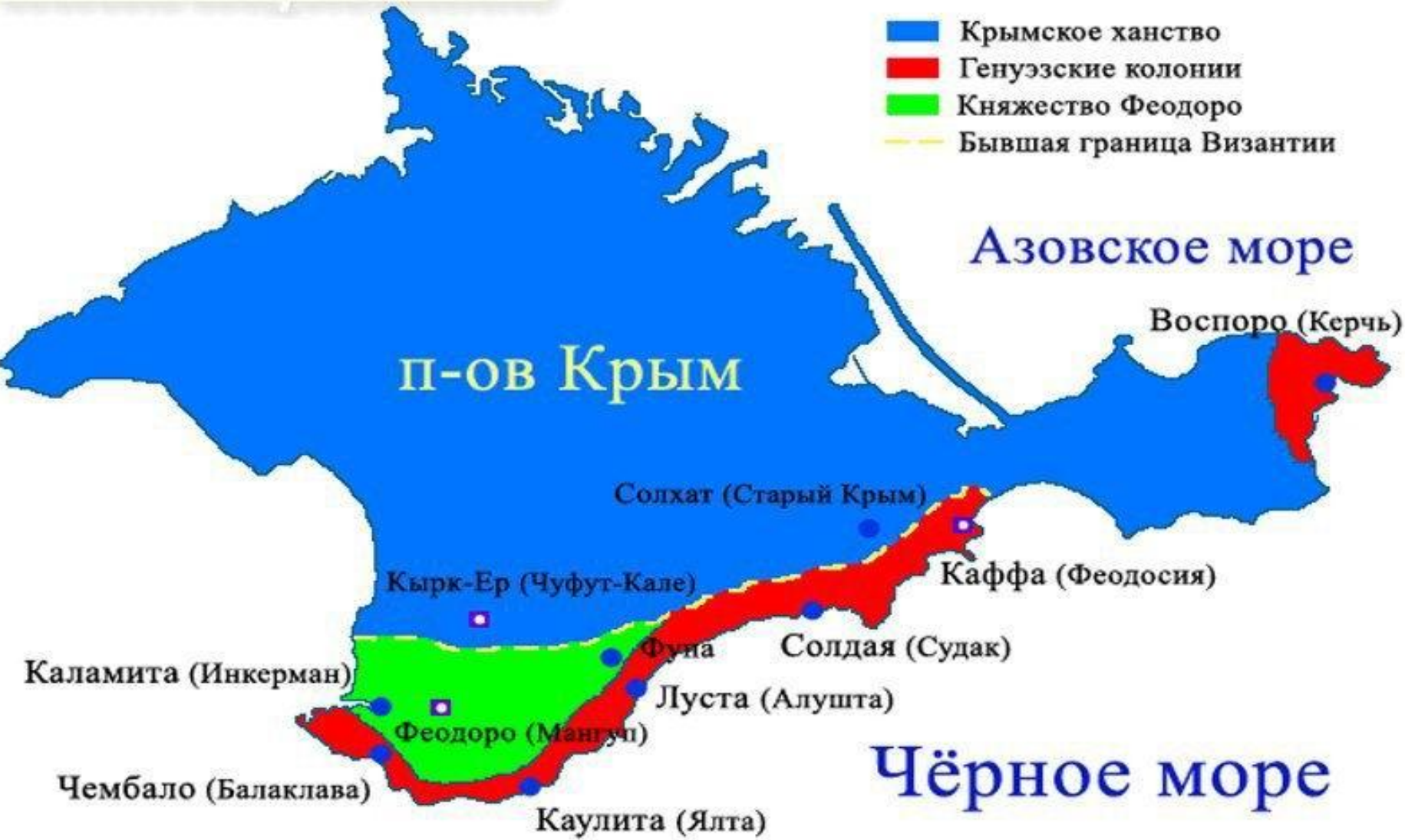
Государственные образования на Крымском полуострове в середине XV века