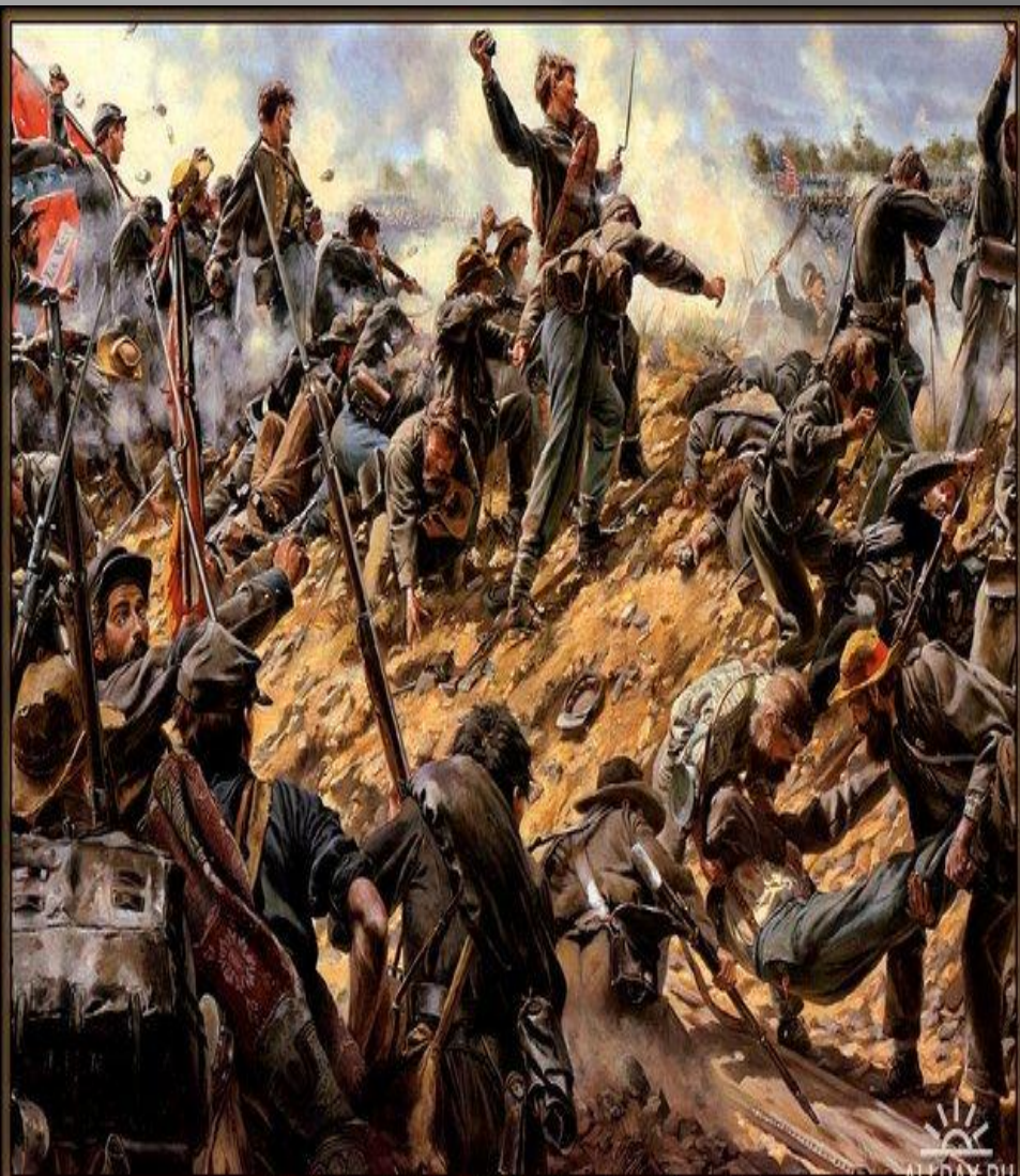
The Diehards Battle of Second Manassas, August 30 1862