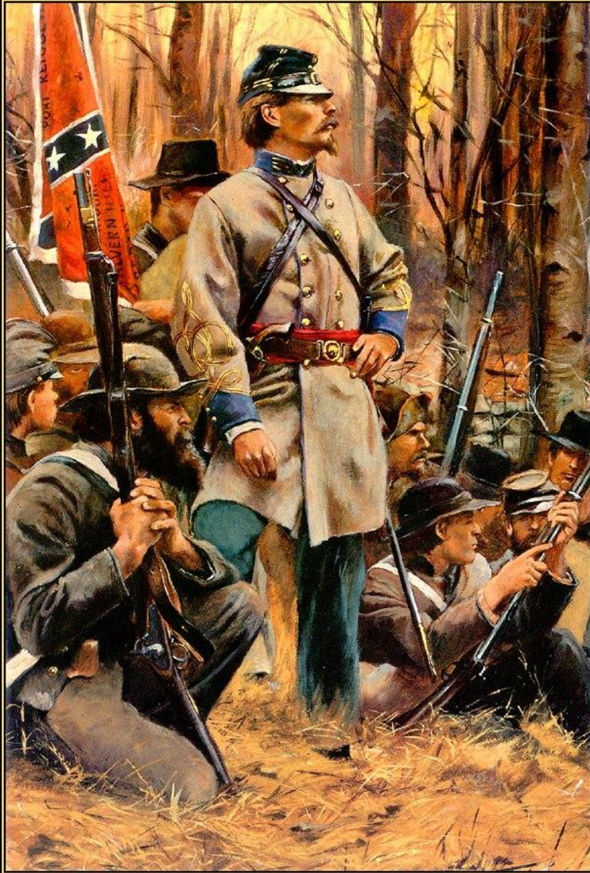
A Confederate Officer With His Men

Юг являлся аграрным «придатком» США, здесь выращивались табак, сахарный тростник, хлопок и рис. Север нуждался в сырье с Юга, особенно в хлопке, а Юг - в машинах Севера.