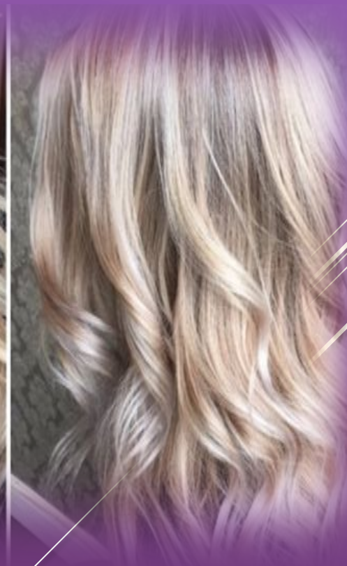
Лунная светлая палитра